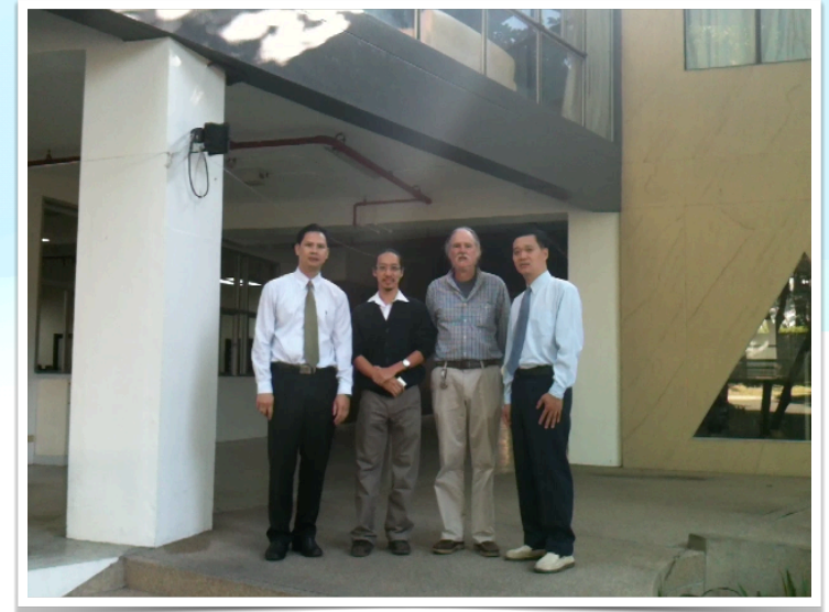
12 ธ.ค. 2555 หารือความร่วมมือด้านวิชาการ คณะสถาปัตยกรรมศาสตร์