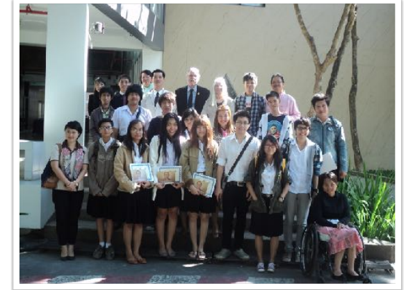
21 ธ.ค. 2554 โครงการ Global Campus Complex Award โดยมูลนิธิโกลบอลแคมปัสเชส ณ คณะสถาปัตยกรรมศาสตร์ มช.