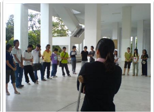
23 ต.ค. 2552 อบรมแนวคิดความพิการ คณะวิทยาศาสตร์