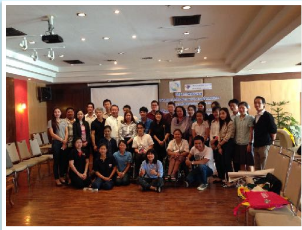
13-16 พ.ย. 2556 การท่องเที่ยวเพื่อคนทั้งมวล ณ รร.ดวงตะวัน