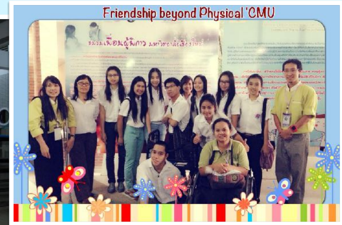
4 ส.ค. 2556 คนค้นคนสัญจร