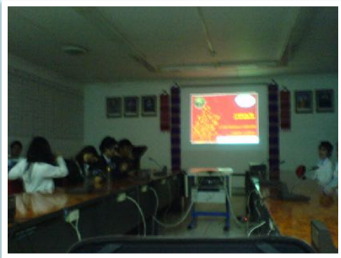
27 พ.ย. 2552 วิทยากรแนวคิดความพิการแก่ดาวและเดือน มช. - คณะเทคนิคการแพทย์