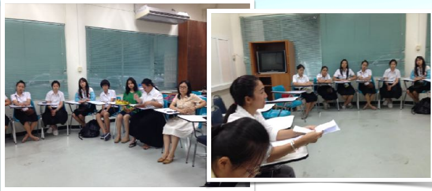
15 ก.ค. 2556 ชมรมเพื่อนผู้พิการ มช.ประชุมหารือกิจกรรม