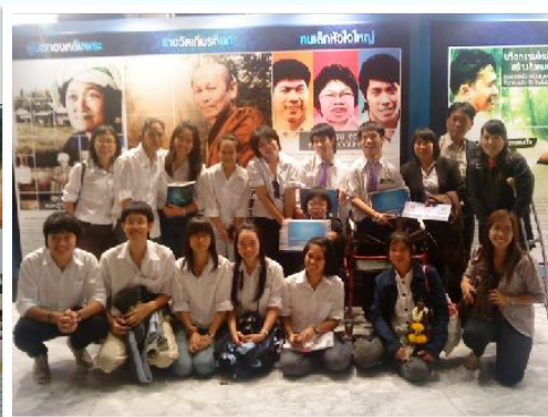
21 ธ.ค. 2553 งานมอบรางวัล คนค้นคนอวอร์ด “สามเกลอ คนเล็ก หัวใจใหญ่”