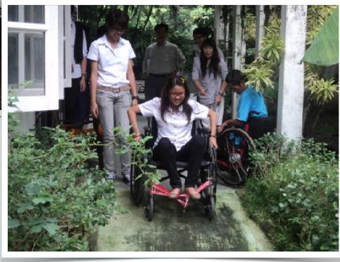
10 ส.ค. 2554 นศ.คณะสถาปัตยกรรมศาสตร์ เยี่ยม สำนักงาน และเรียนรู้จำลองความพิการ