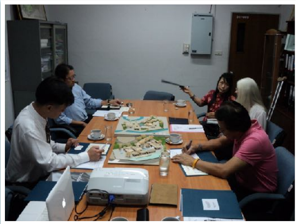
13 มี.ค. 2555 ประชุมคณะกรรมการที่ปรึกษา มูลนิธิโกลบอลแคมปัสเชส ณ สำนักบริการวิชาการ