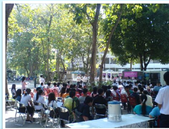
8 พ.ย. 2552 วิทยากร มช. เต็มหัวใจให้สังคม