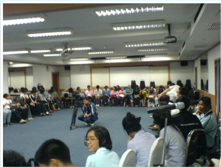
22-23 ธ.ค. 2552 workshop หนึ่งสั้นคนพิการ ณ สำนักบริการวิชาการ มช.