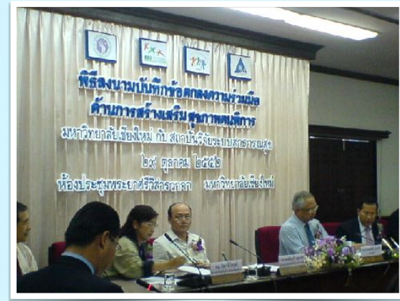
29 ต.ค. 2552 ร่วมเป็นสักขีพยาน MOU