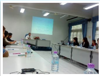
30 มี.ค. 2554 สัราวจสิ่งอำนวยความสะดวก ร่วมกับชมรมเพื่อนผู้พิการ มช.