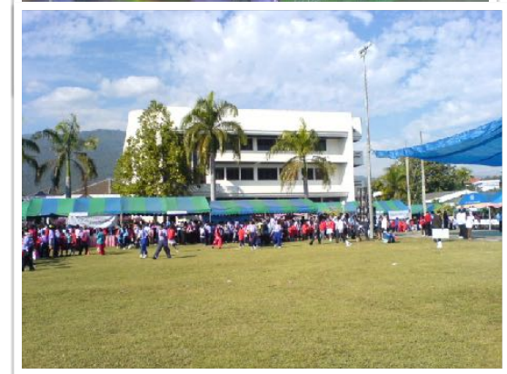
ชมรมเพื่อนผู้พิการ มข.ร่วมจัดกิจกรรมกับ GCC ในงานสุขภาพจิตผู้พิการ ณ สถาบันพัฒนาการเด็กราชนครินทร์