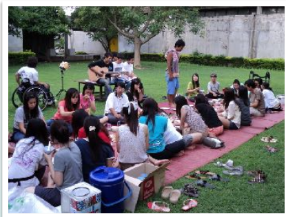
4 ม.ย. 2555 กิจกรรม ทำอาหารร่วมกัน โดยชมรมเพื่อนผู้พิการ มช. ณ หอศิลป์วัฒนธรรม มช.