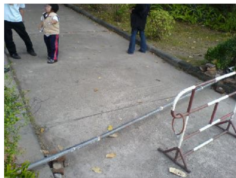
9 ม.ค. 2553 ลงพื้นที่สำรวจสถานที่เพื่อเตรียมความพร้อมในการเรียนของ “สามเกลอ” (หอพัก/อาคารเรียน/หอสมุด)