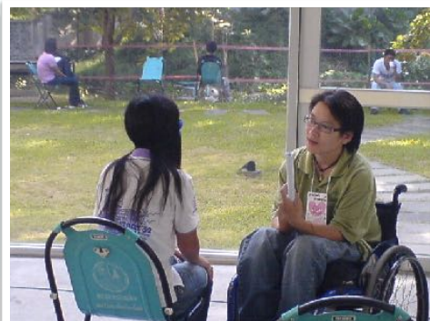
30 ต.ค. ถึง 1 พ.ย. 2552 อบรมจริยธรรมนักศึกษา มช.