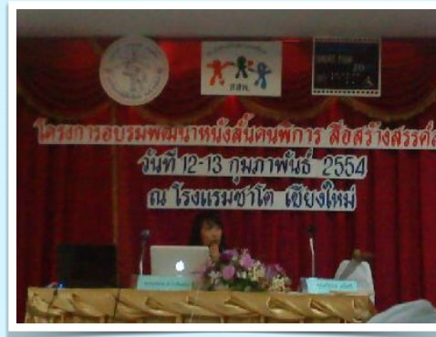
12-13 ก.พ. 2554 วิทยากร แนวคิดความพิการ ในโครงการประกวดหนังสือสั้น