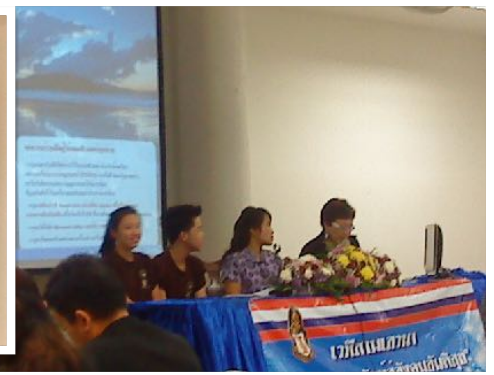
4 ธ.ค. 2553 วิทยากรเสวนา โดยคณะศึกษาศาสตร์ มช.