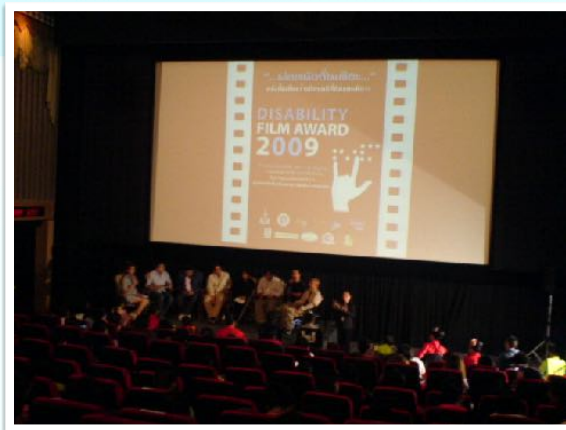
9-14 ก.พ. 2553 - การประกวดหนังสั้น