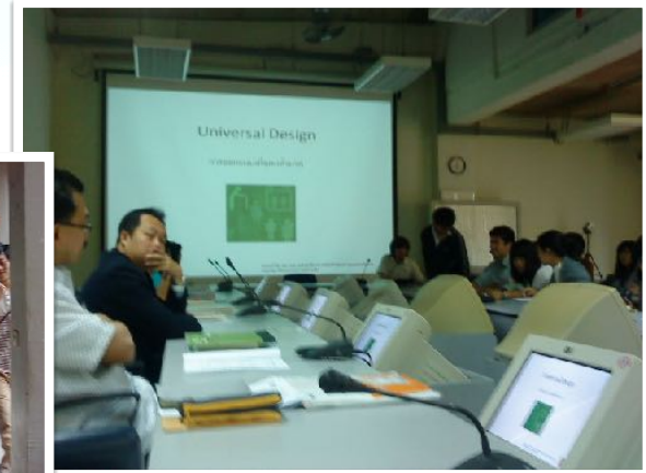
2 เม.ย. 2554 วิทยากรผู้ช่วยกระบวนการจำลองความพิการ ณ คณะสถาปัตยกรรมศาสตร์ มช.