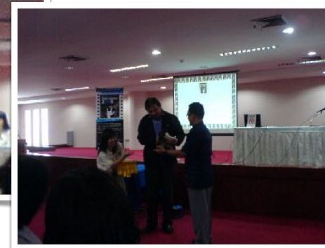
พ.ย. 2552 วิทยากร ประกวดหนึ่งสั้นเพื่อปรับทัศนคติที่ดีต่อคนพิการ