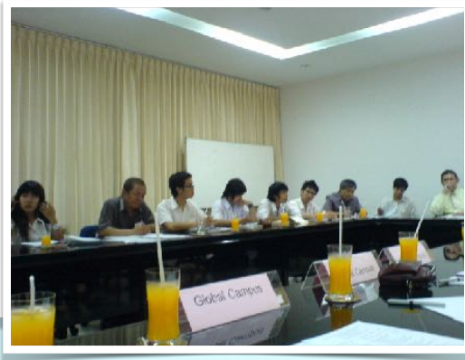
31 มี.ค. 2552 ประชุมร่วมกับผู้บริหาร มช. โดย ชมรมเพื่อนผู้พิการ มช. ณ สำนักงานมหาวิทยาลัยเชียงใหม่