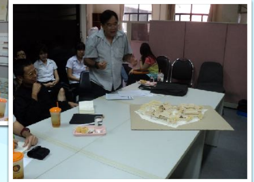
26 ก.ค. 2554 คณะกรรมการพิจารณาโมเดลการออกแบบโดยหลัก Universal Design ณ คณะสถาปัตยกรรมศาสตร์ มช.