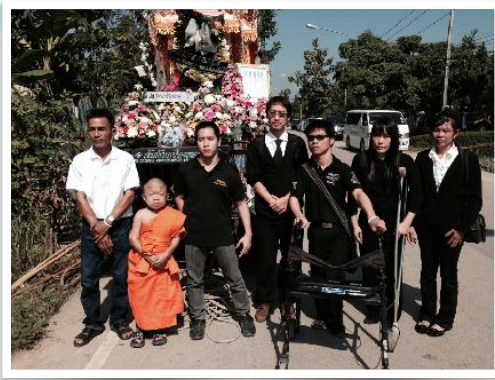
3 ธ.ค. 2566 ร่วมงานฉาปณกิจ น้องจอย