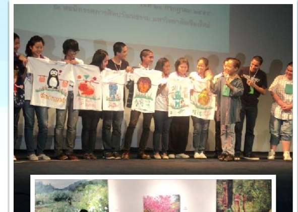
21-22 ก.ค. 2555 วิทยากรอบรมจริยธรรม ณ หอศิลป์วัฒนธรรม มช.