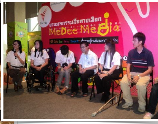
28-29 ก.ย. 2555 “มีดี มีเดีย” โดยชมรมเพื่อนผู้พิการ มช. ณ ThaiPBS