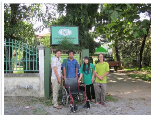
17 มิ.ย. 2555 GCC บริจาครถเข็นให้นักศึกษาเพื่อมอบให้แก่คนพิการ