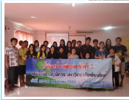
26-28 มี.ค. 2555 ค่ายสร้างเพื่อน โดยชมรมเพื่อนผู้พิการ มช.