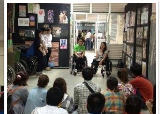
8 ก.ย 2556 อบรมจริยธรรมนักศึกษาปีที่1 คณะวิจิตรศิลป์