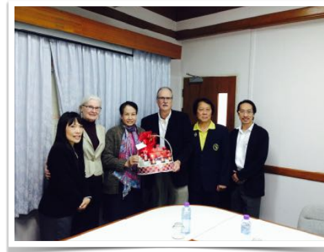
16 ธ.ค. 2566 พบผอ.กองพัฒนาพิเศษ