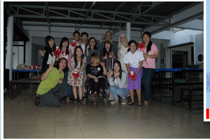
20 ม.ค. 2556 GCC ร่วมแสดงความยินดีกับบัณฑิตใหม่