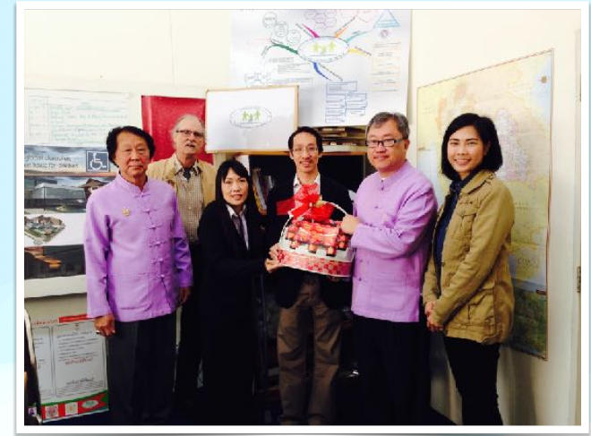
20 ธ.ค. 2556 พบ ผอ. สถาบันภาษา