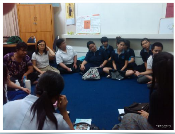
19 มิ.ย. 2556 ชมรมเพื่อนผู้พิการ มช.ประชุมหารือกิจกรรม