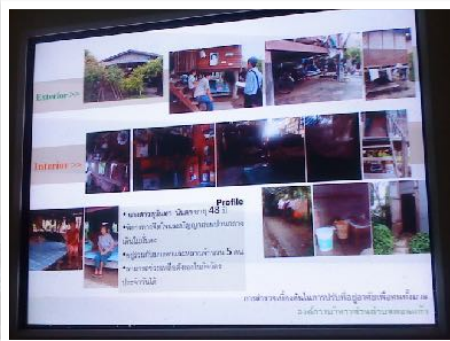
23-24 ก.ค. 2554 วิทยาการอบรมจริยธรรมนักศึกษาปีที่ 1 มช. ณ หอศิลป์วัฒนธรรม มช.