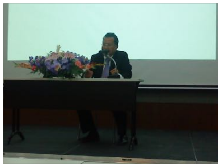
1-2 ธ.ค. 2553 ร่วมอบรมธุรกิจเพื่อสังคม SE ณ คณะบริหารธุรกิจ มช.