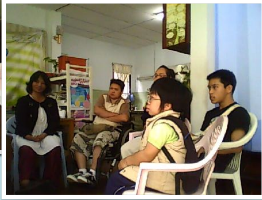
ผู้จัดการโครงการ สสส.ให้การสนับสนุน “สามเกลอ” ว่าที่นักศึกษาพิการ มข.