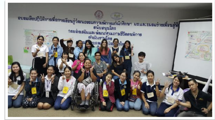
7 พ.ย. 2558 จัดอบรมความรู้ให้กับนักศึกษาของชมรมเพื่อนผู้พิการ มช. ณ สำนักบริการวิชาการ มช.