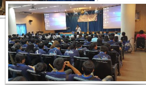
21 ส.ค. 2559 วิทยากร ค่ายเสริมสร้างจิตสำนึกวิชาชีพครู 2 ณ คณะศึกษาศาสตร์