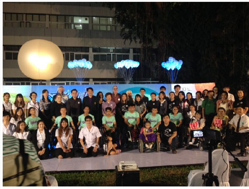
19 พ.ย. 2557 พิธีเปิดโครงการ หอมพินธรรมดาเพื่อคนพิเศษ ณ คณะทันตแพทยศาสตร์