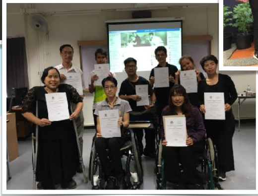
7 ต.ค. 2560 ร่วมอบรมเทคนิคการใช้ smartphone สำหรับงานชุดอารยสถาปัตย์ ณ คณะการสื่อสารมวลชน