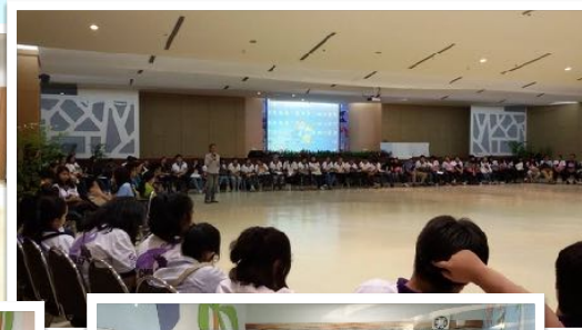
21/28 ก.ย. 2557 อบรมจริยธรรม นศ.ปีที่1 ณ สถาบันพัฒนาการเด็กราชนครินทร์