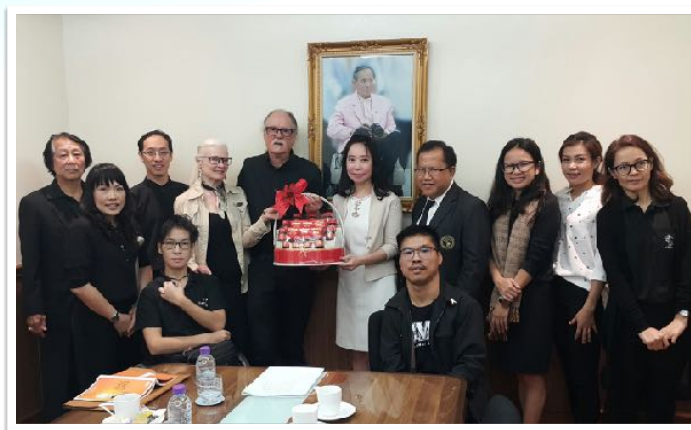
29 ธ.ค. 2559 พบรองอธิการบดีและหัวหน้ากองพัฒนานักศึกษาพิเศษ