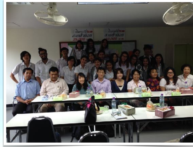
19 พ.ย. 2557 Focus Group FM 100 MHz.