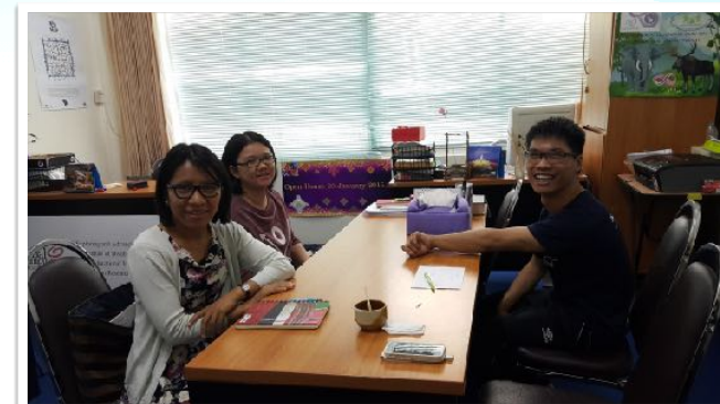
12 ส.ค. 2558 คณาจารย์คณะศึกษาศาสตร์หารือความร่วมมือทางวิชาการ