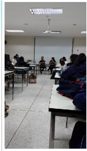
21 พ.ย. 2559 วิทยากร วัฒนธรรมความพิการ ในวิชาการศึกษาพิเศษ ณ คณะศึกษาศาสตร์