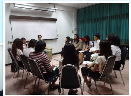
4 ก.ย. 2557 นักศึกษาคณะทันตแพทยศาสตร์ เรียนรู้ community base approach