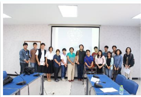
26 มี.ค. 2559 ร่วมเสวนา ผลเรียน การศึกษาในศต.21