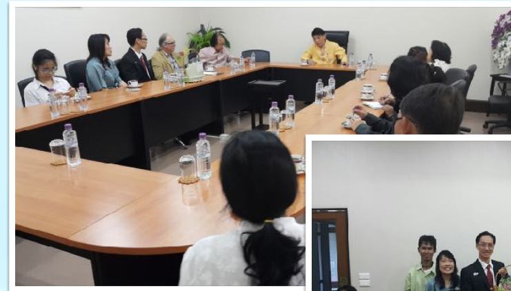
28 ธ.ค. 2558 รายงานความก้าวหน้าให้กับรองอธิการบดี