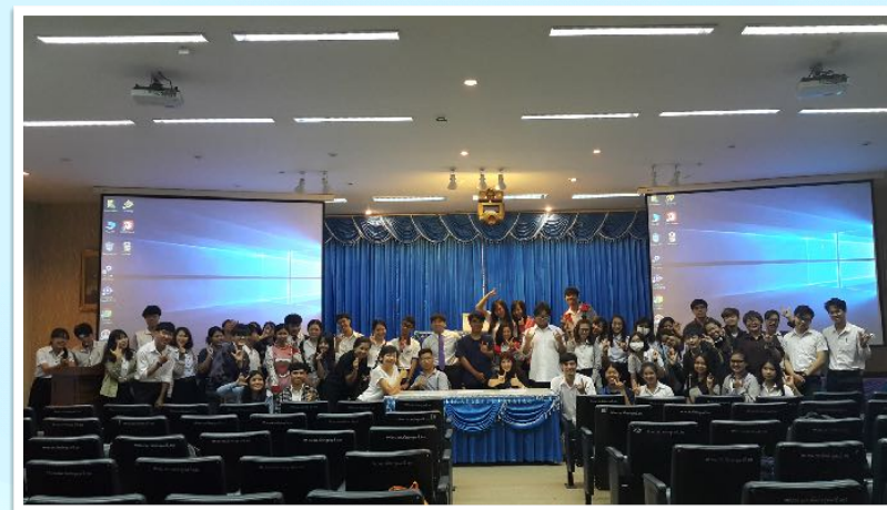
24 เม.ย. 2559 วิทยากร วัฒนธรรมความพิการ วิชาการศึกษาพิเศษ ณ คณะศึกษาศาสตร์