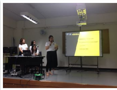
1 ธค. 2557 วิทยากร งาน PR ณ คณะการสื่อสารมวลชน