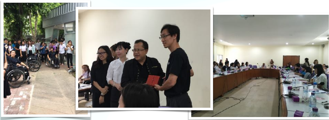
2 มิ.ย. 2560 วิทยากร วัฒนธรรมความพิการ สำหรับนักศึกษาหอพัก โดย DSS CMU