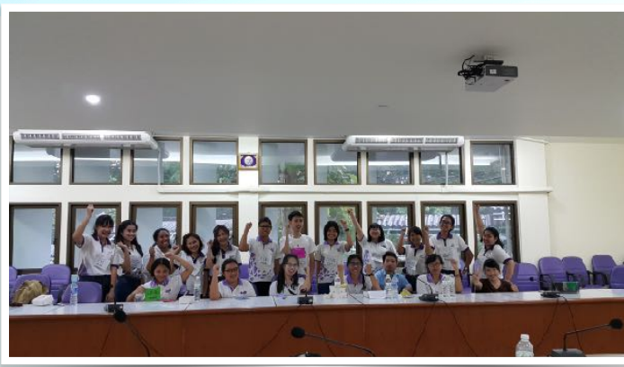
27 ส.ค. 2559 สักรางสิ่งอำนวยความสะดวก โดยชมรมเพื่อนผู้พิการ มช.