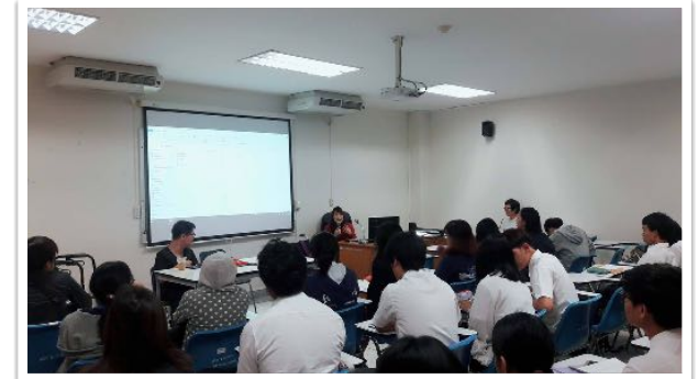
13 พ.ย. 2560 วิทยากร วัฒนธรรมความพิการ ในวิชาการศึกษาพิเศษ