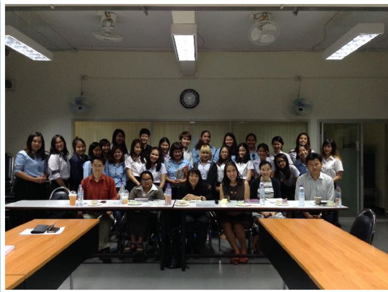
20 ต.ค. 2557 วิพากษ์ Media Lab คณะการสื่อสารมวลชน