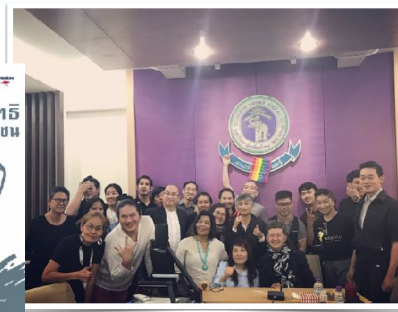
1 ต.ค 2560 ร่วมเสวนา คณะกรรมการสิทธิมนุษยชนแห่งชาติ โดยคณะศึกษาศาสตร์