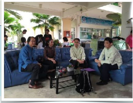
14 ก.ย. 2559 จัดอบรม วัฒนธรรมความพิการ โดยสถาบันภาษา มช.