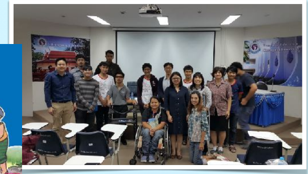
21 ต.ค. 2558 ร่วมสัมมนาวิชาการ โดยคณะศึกษาศาสตร์