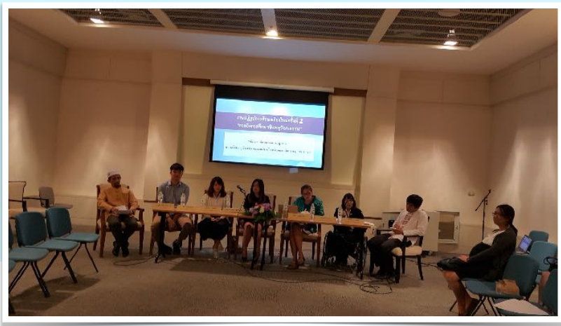
31 ม.ค. 2560 วิทยากรร่วมเสวนา งานปฏิรูปการศึกษาเชียงใหม่ ครั้งที่ 2 โดย คณะศึกษาศาสตร์