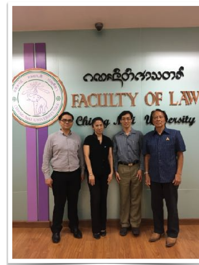
4 ก.ย. 2560 พบคณบดีคณะนิติศาสตร์