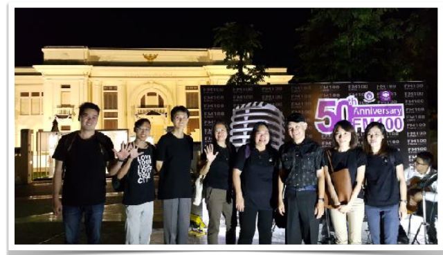
20 พ.ย. 2559 ร่วมงาน 50 ปี มช. โดยคณะกรรมการสื่อสารมวลชน