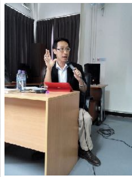
4 พ.ย. 2557 วิทยากร วัฒนธรรมความคิด การ คณะการสื่อสารมวลชน