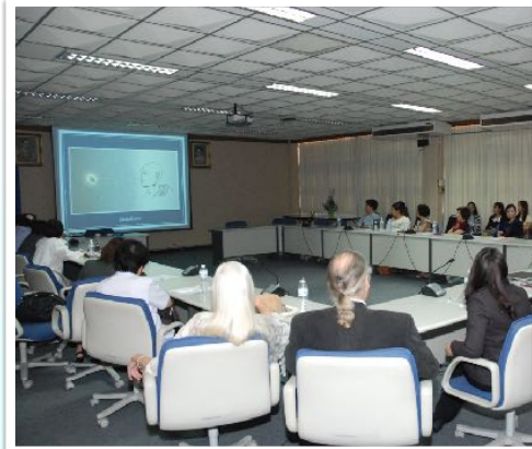
27ก.พ. 2558 วิทยากร วัฒนธรรมความพิการ ณ คณะทันตแพทยศาสตร์