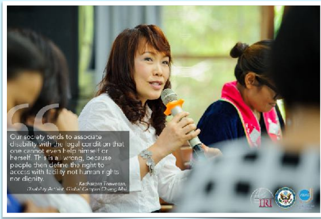
27 เม.ย. 2560 วิทยากร บทบาทสตรี โดย คณะสังคมศาสตร์