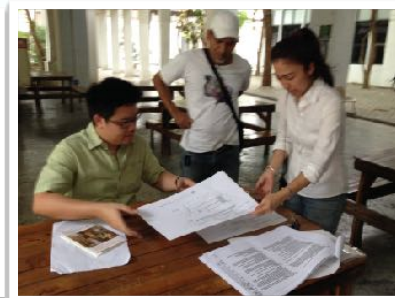
22 เม.ย. 2557 สํารวจอาคารเพื่อปรับปรุงสิ่งอำนวยความสะดวก ณ คณะวิจิตรศิลป์