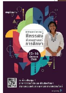
16 ธ.ค. 2560 ร่วมงานวิชาการเกษียณอายุราชการ โดย คณะศึกษาศาสตร์