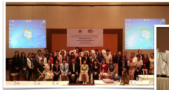
27 พ.ย. 2558 วิทยากรเสวนา คณะเทคนิคการแพทย์