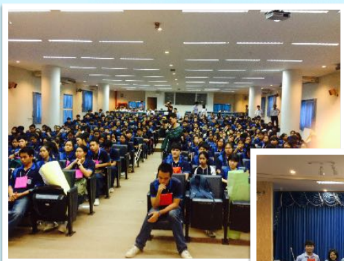
22 ส.ค. 2558 วิทยากรค่ายเสริมสร้างจิตสำนึกครู ณ คณะศึกษาศาสตร์