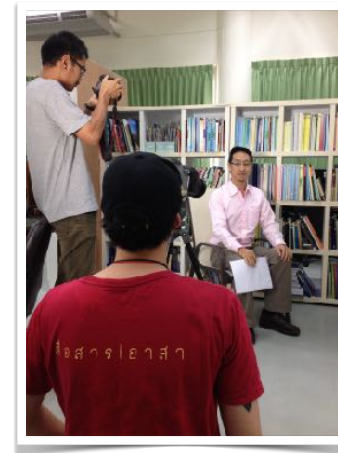
11 พ.ย. 2557 ช่วยงาน นศ. คณะการสื่อสารมวลชน วิชา วารสารโทรทัศน์