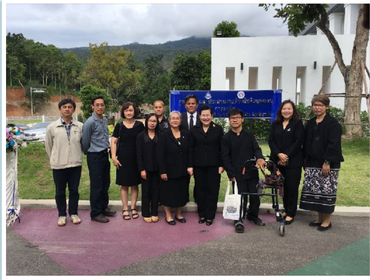
9 ส.ค. 2560 ร่วมพิธีเปิดศูนย์ประสานงานสิทธิมนุษยชนภาคเหนือ ณ คณะนิติศาสตร์