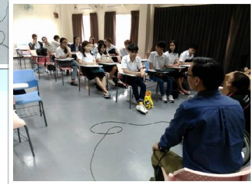
11 มี.ค. 2559 วิทยากร วัฒนธรรมความพิการ ในวิชา environmental portait ณ คณะการสื่อสารมวลชน