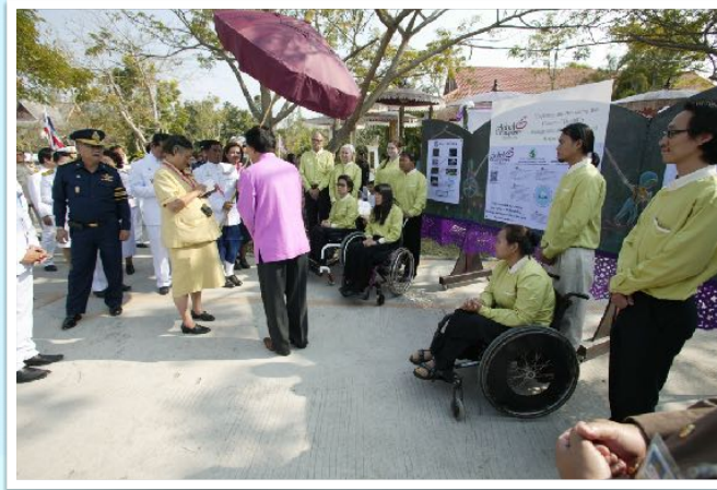
20 ม.ค. 2557 รับเสด็จสมเด็จพระเทพฯ ณ ศูนย์การศึกษาพิเศษจ.ลำพูน