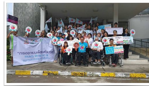
17 ก.ค. 2560 ร่วมโครงการการออกแบบที่เป็นมิตรเพื่อคนทั้งมวล โดย คณะทันตแพทยศาสตร์