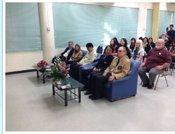
28 ม.ค. 2558 Open House