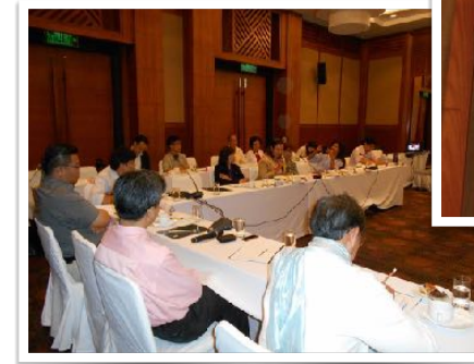
23 มี.ค. 2558 ประชุมระดมความเห็น โดย คณะทันตแพทยศาสตร์