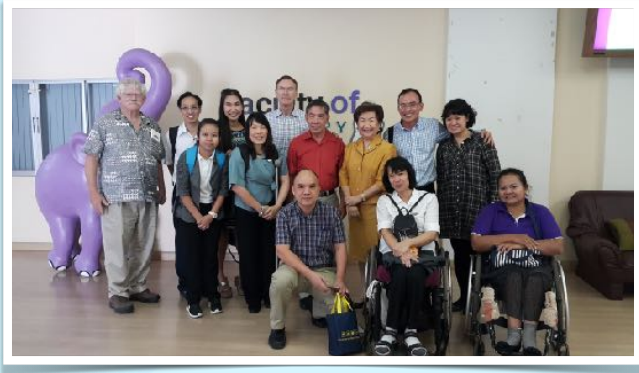
28 ธ.ค. 2558 แลกเปลี่ยนประสบการณ์ความพิการจากประเทศสิงคโปร์ ณ คณะทันตแพทยศาสตร์