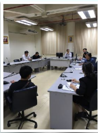
28 ก.ย. 2560 GCF / GCC พบคณบดีคณะสถาปัตยกรรมศาสตร์