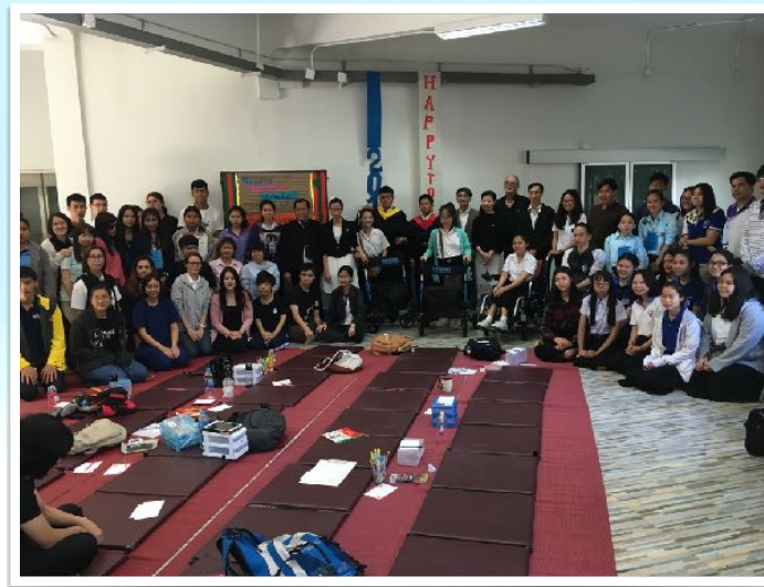
25 ม.ค. 2560 GCF / GCC ร่วมกิจกรรมสานสัมพันธ์ โดย DSS CMU