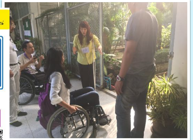
12 พ.ย. 2560 วิทยากร อบรมการช่วยเหลือคนพิการเบื้องต้น โดยชมรมเพื่อนผู้พิการ มช.