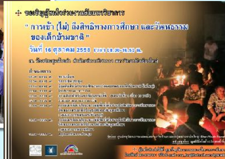
16 ต.ค 2558 ร่วมสัมมนาวิชาการ โดยคณะศึกษาศาสตร์