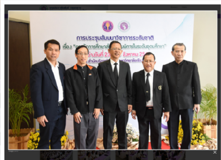
24-25 ส.ค. 2560 ร่วมสัมมนาระดับชาติ การศึกษาคณพิการในระดับอุดมศึกษา