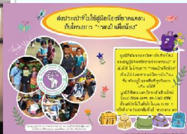
2558 รวบรวมกระเป๋าจากงานอบรม เพื่อบริจาคแก่มูลนิธิพัฒนามหาวิทยาลัยเชียงใหม่