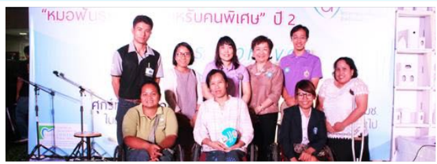
30 ตค. 2558 ร่วมงานหอพักธรรมดา สำหรับคนพิเศษ ปี 2 ณ คณะทันตแพทยศาสตร์