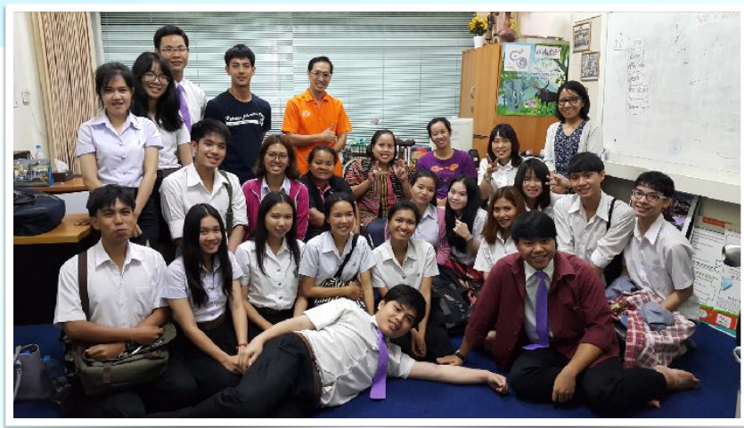
14 ก.ย. 2558 วิทยากรวิชา พหุวัฒนธรรม ให้กับศ.คณะศึกษาศาสตร์