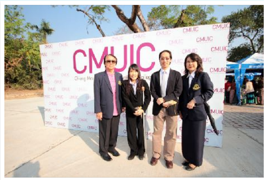
27 ม.ค. 2557 พิธีเปิดอาคาร International College