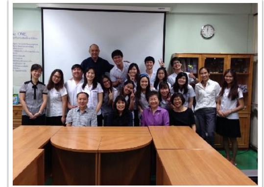
26 ก.ย. 2557 - รับฟังการนำเสนอ นศ.ทันตแพทยศาสตร์