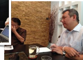
18 มี.ค. 2557 พบคณบดีคณะวิศวกรรมศาสตร์