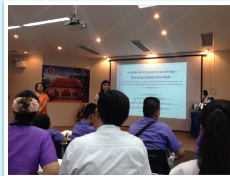
21 พ.ค. 2558 ร่วมสัมมนาวิชาการ ณ คณะศึกษาศาสตร์