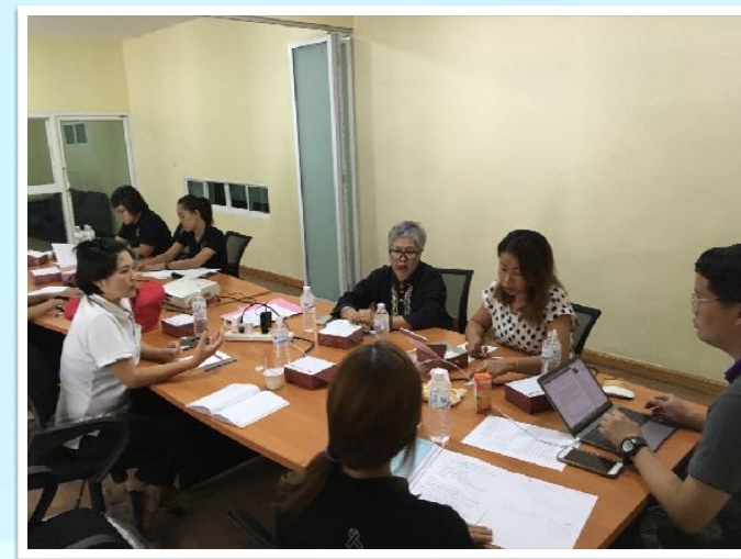
13 พ.ค. 2560 ถอดบทเรียนแรงงานนอกระบบ โดยคณะมนุษยศาสตร์