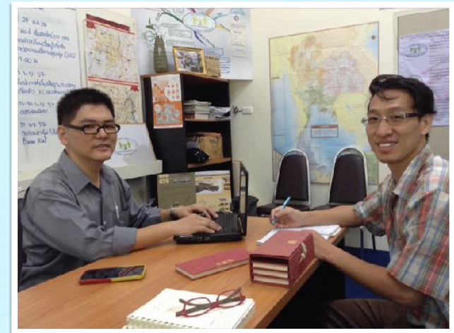
21 ต.ค. 2557 อาจารย์จากคณะกรรมการสื่อสารมวลชน หารือวิชาถ่ายภาพ