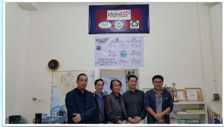
11 ส.ค. 2560 คณะอาจารย์คณะสถาปัตยกรรมศาสตร์หารือการดำเนินงานร่วมกัน