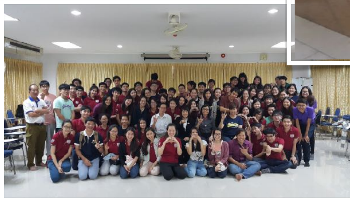
27 ก.พ. 2559 วิทยากรโครงการหมอฟันปันยิ้มให้คนพิเศษ ณ คณะทันตแพทยศาสตร์