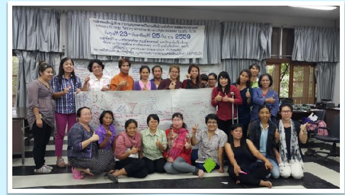
23-25 ก.ย. 2559 ร่วมอบรมความเสมอภาคระหว่างเพศ โดยคณะสังคมศาสตร์