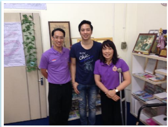
2 เม.ย. 2558 หนึ่ง ETC เยี่ยมสำนักงาน GCF ณ สถาบันภาษา มช.