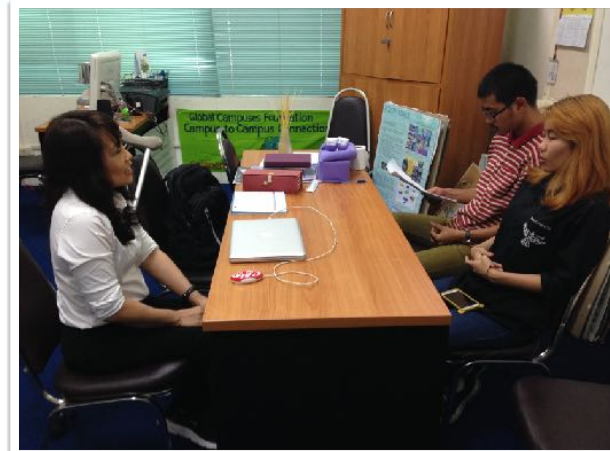
27 ต.ค. 2557 นศ. คณะการสื่อสารมวลชน หารือการทำสารคดี