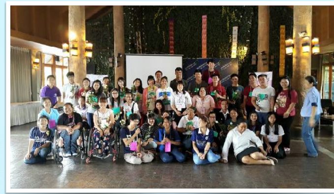
29-30 ส.ค. 2558 วิทยากรค่ายสร้างเพื่อน โดยชมรมเพื่อนผู้พิการ มช.