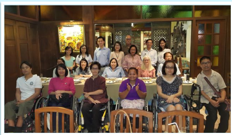
1 เม.ย. 2559 ประชุมคณะที่ปรึกษามูลนิธิโกลบอลแคมป์สเสส