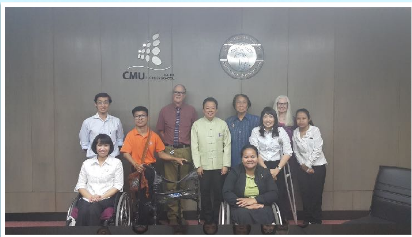
24 ก.พ. 2559 พบคณบดีคณะบริหารธุรกิจเพื่อหารือความร่วมมือ ณ คณะบริหารธุรกิจ