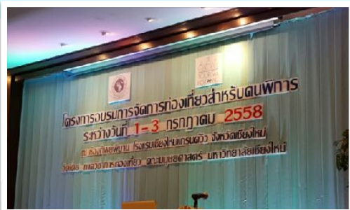
1-3 ก.ค. 2558 ร่วมอบรมการท่องเที่ยวสำหรับคนพิการ โดยคณะมนุษยศาสตร์