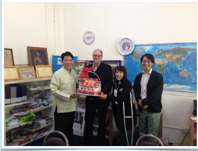
14 ม.ค. 2558 รายงานความก้าวหน้าให้กับรองอธิการบดี มช.