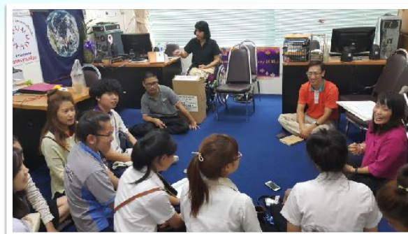
29 มี.ค. 2559 วิทยากร วัฒนธรรมความพิการในวิชา พหุวัฒนธรรม โดย คณะศึกษาศาสตร์