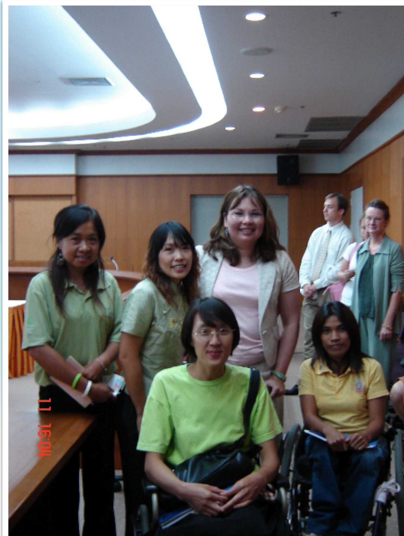
11 มิ.ย. 2551 GCC ได้รับเชิญ ให้ร่วมกิจกรรมของกงสุลอเมริกันประจำจ.เชียงใหม่ “ Ladda Tammy Duckworth ” ณ หอสมุด มช. และกงสุลอเมริกัน