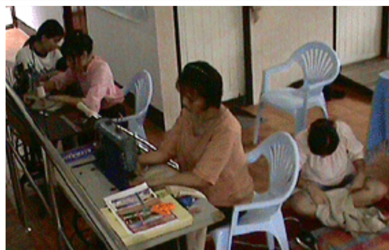
ชั้นเรียนตัดเย็บผ้า