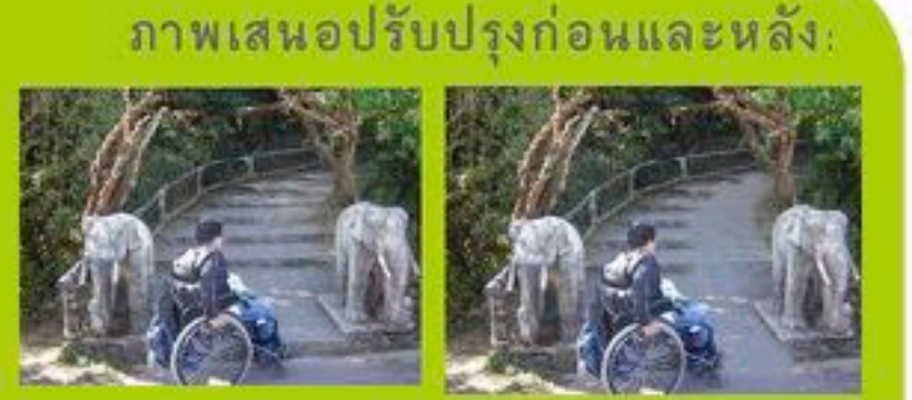
ภาพเสนอปรับปรุงก่อนและหลัง: