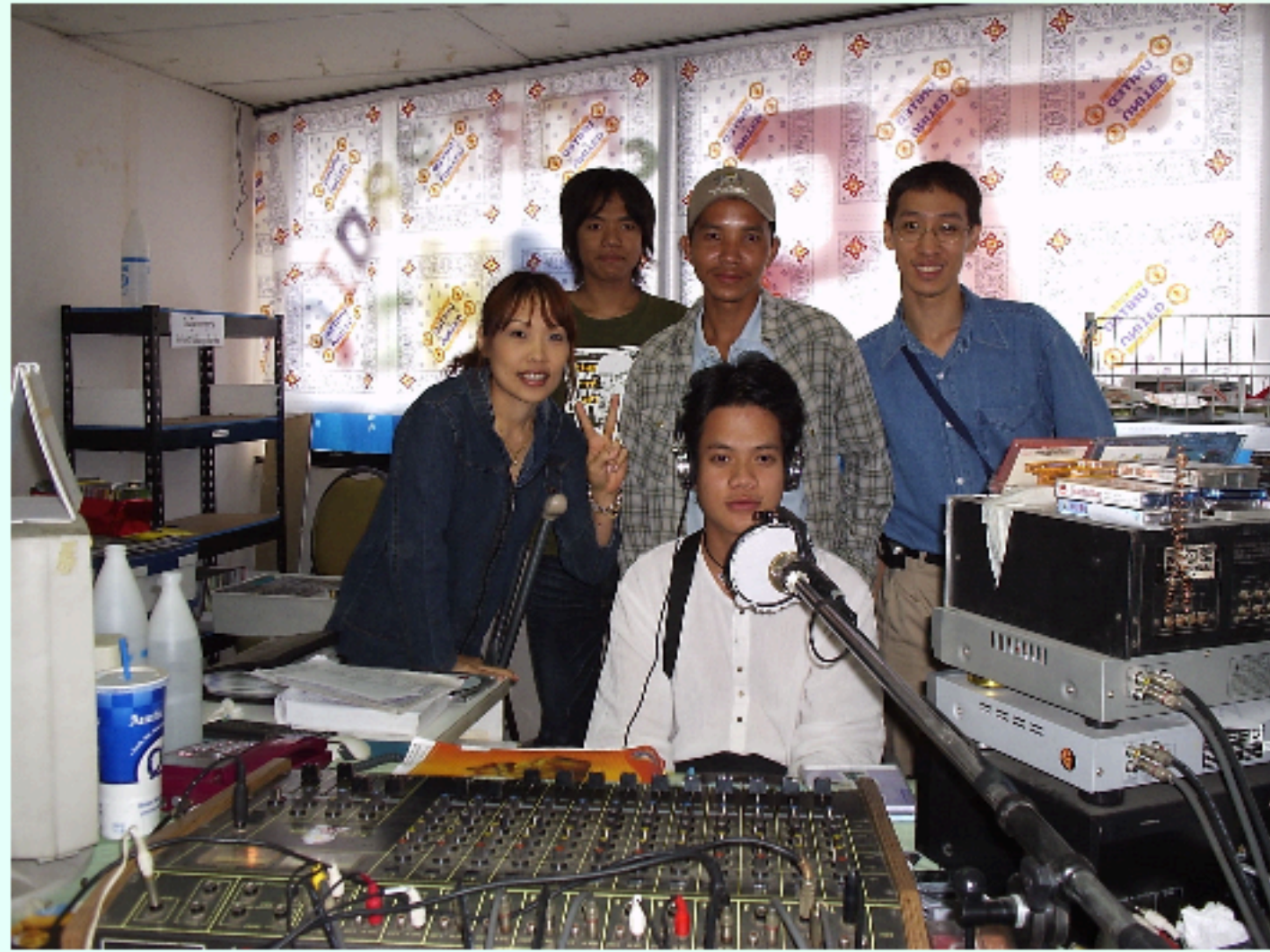
FM 91.75 MHz.

FM. 96.25 MHz คลื่นข่าวสาร สยามเพรสเรดิโอ