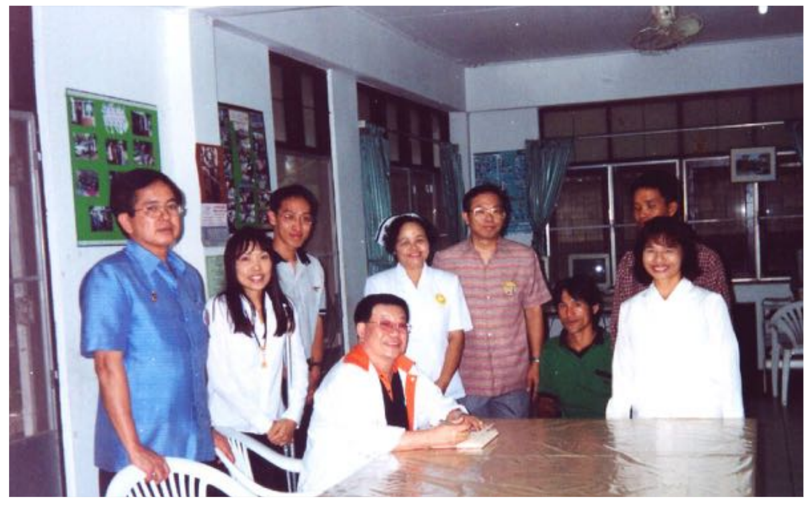
อธิบดีกรมสุขภาพจิต (สถาบันพัฒนาการเด็กราชนครินทร์)