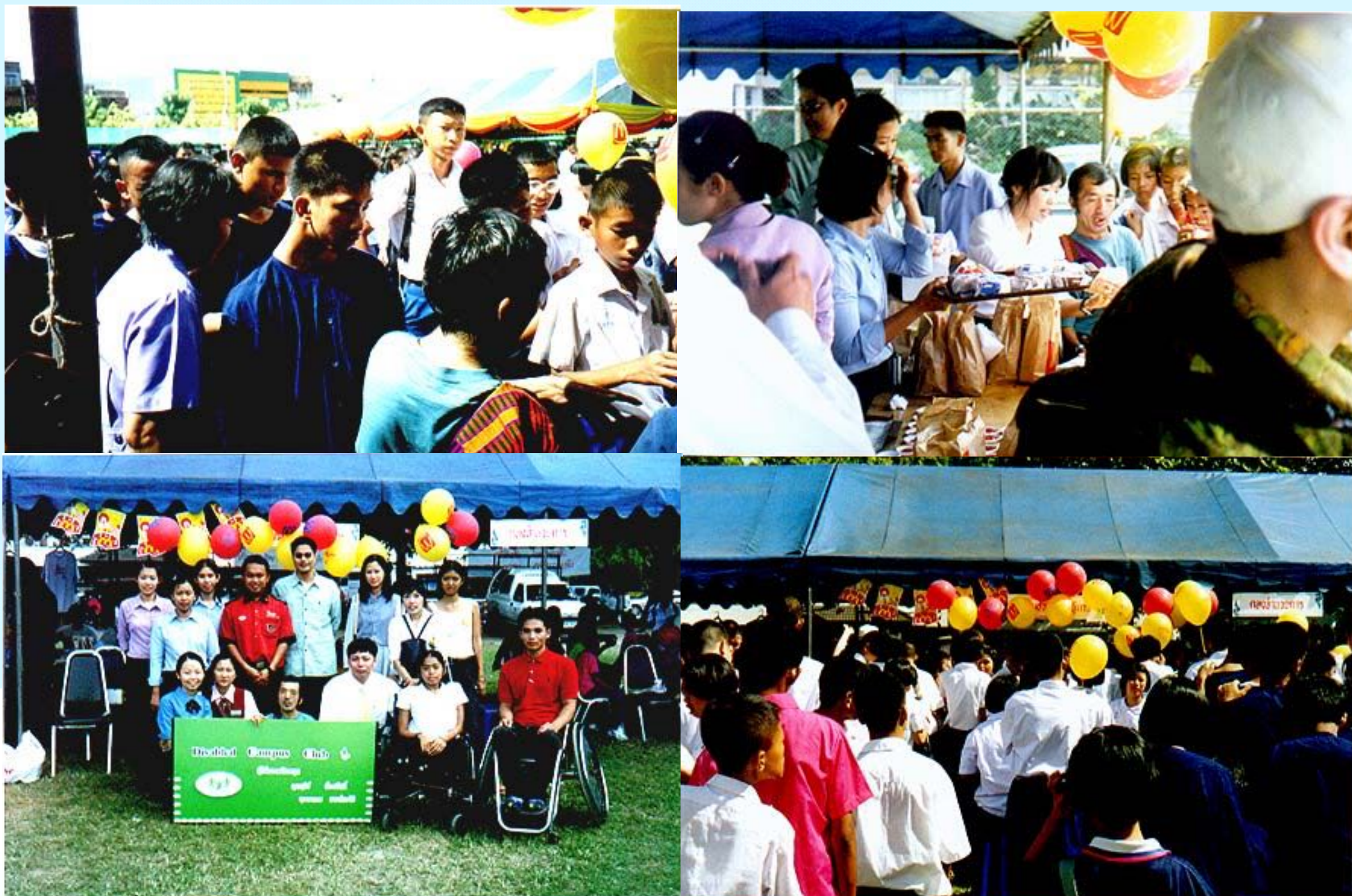
งานวันคนพิการสากล.เชียงใหม่ นำอาหารและเครื่องดีมจากMcDonald มอบให้คนพิการ ณ มหาวิทยาลัยราชภัฏเชียงใหม่