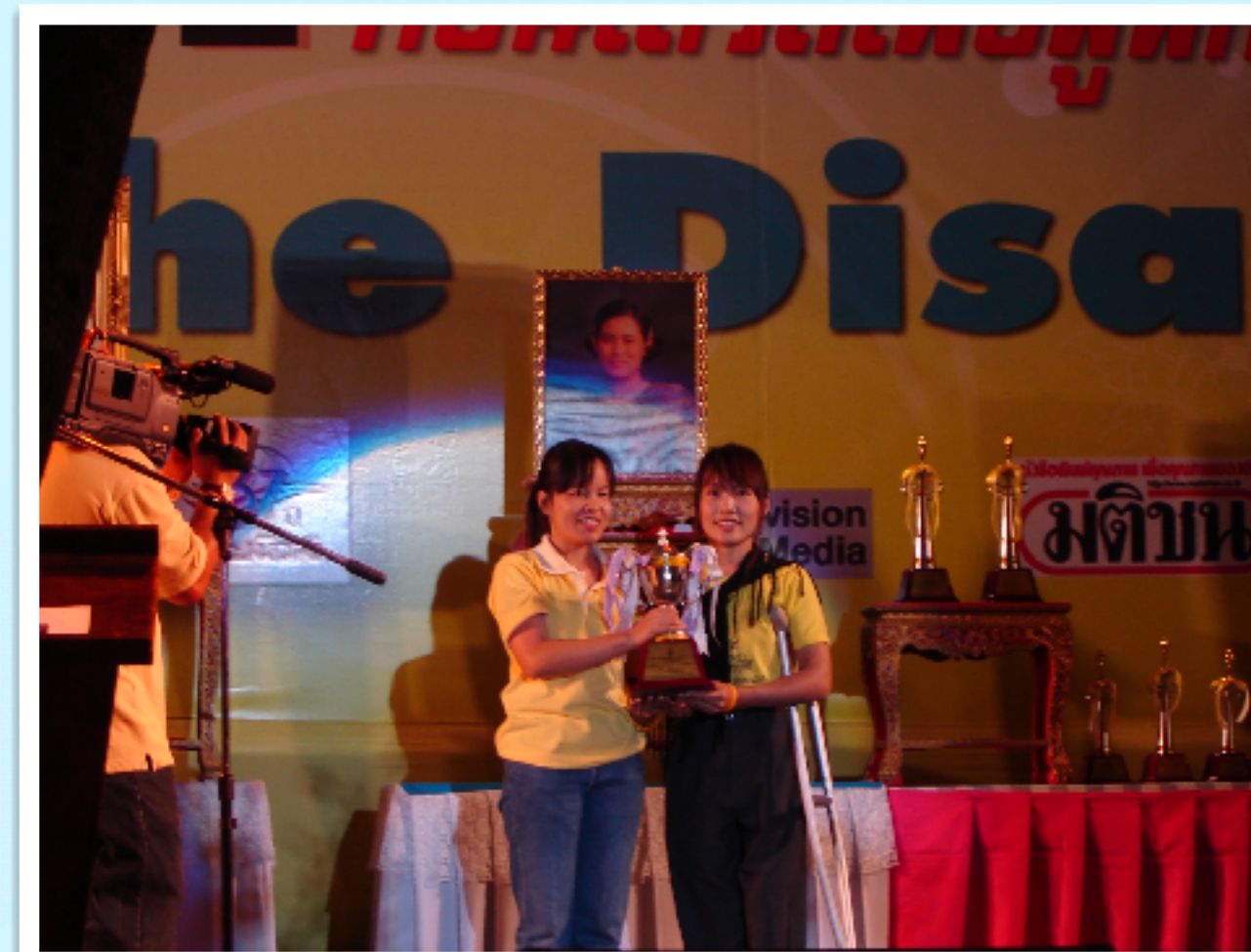
งานวันคนพิการสากล.เชียงใหม่ รับถ้วยพระราชทานของสมเด็จพระเทพฯ ณ ศาลาอ่างแก้ว มช.