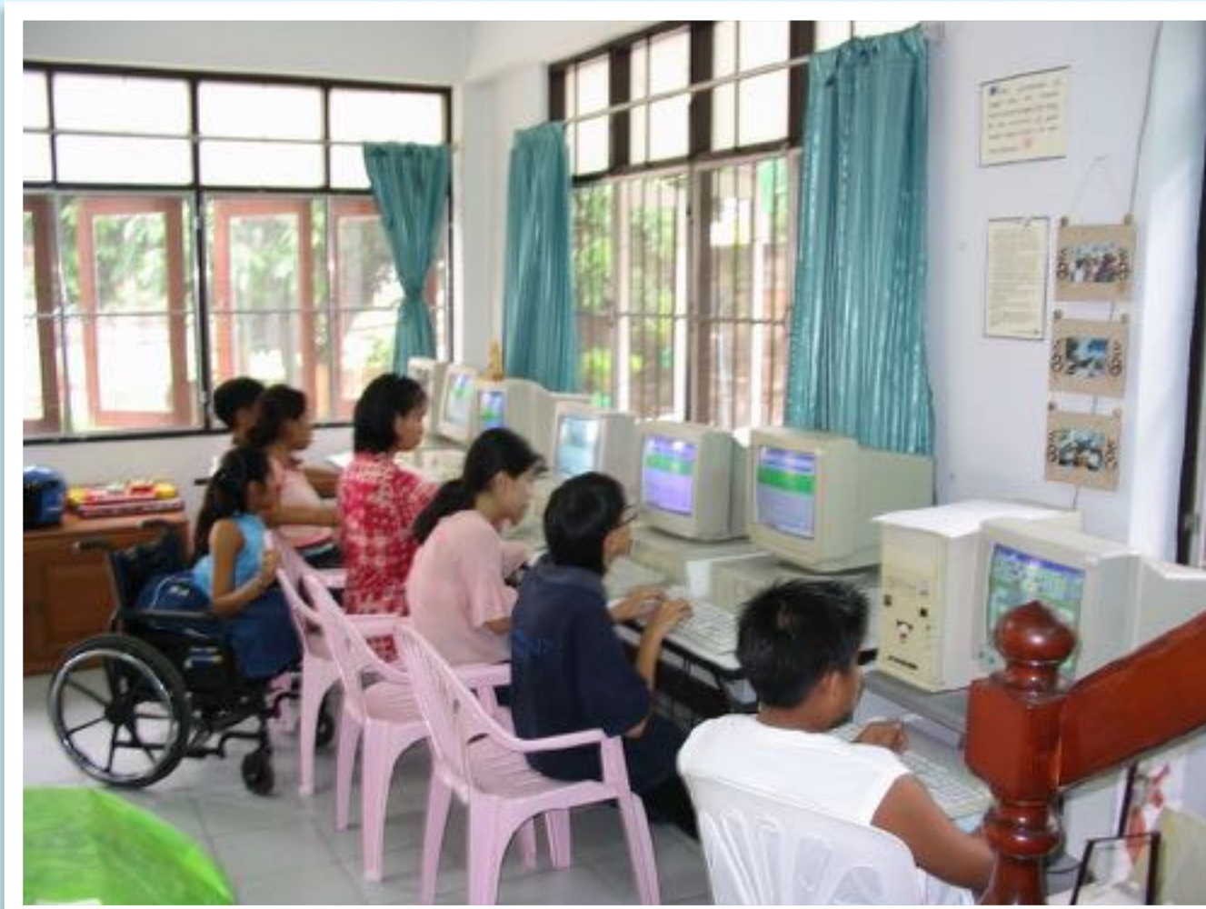
ชั้นเรียนคอมพิวเตอร์