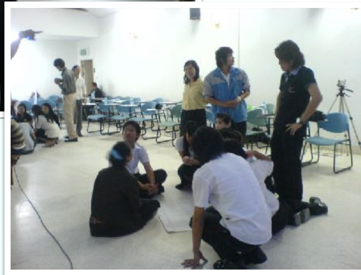
18 ส.ค. 2551 วิทยากรความเสมอภาคคนพิการ คณะเทคนิคการแพทย์