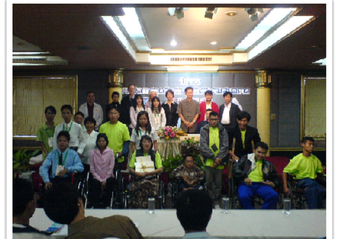
กระทรวงพัฒนาสังคมและความมั่นคงของมนุษย์