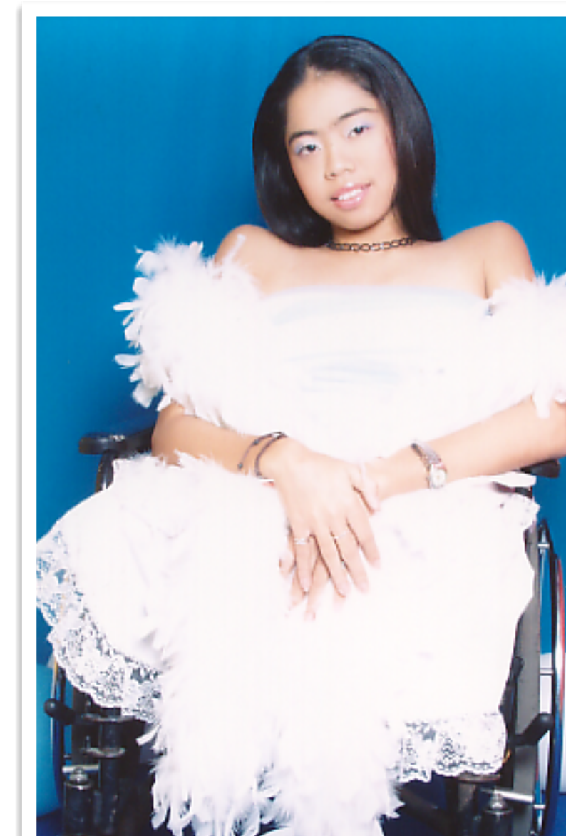
“น้องหนู” เข้าประกวด The Star ครั้งที่ 1