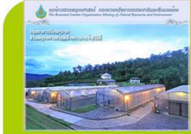
100 หมู่ 9 ต.แม่แรม อ.แม่ริม จ.เชียงใหม่ 50180