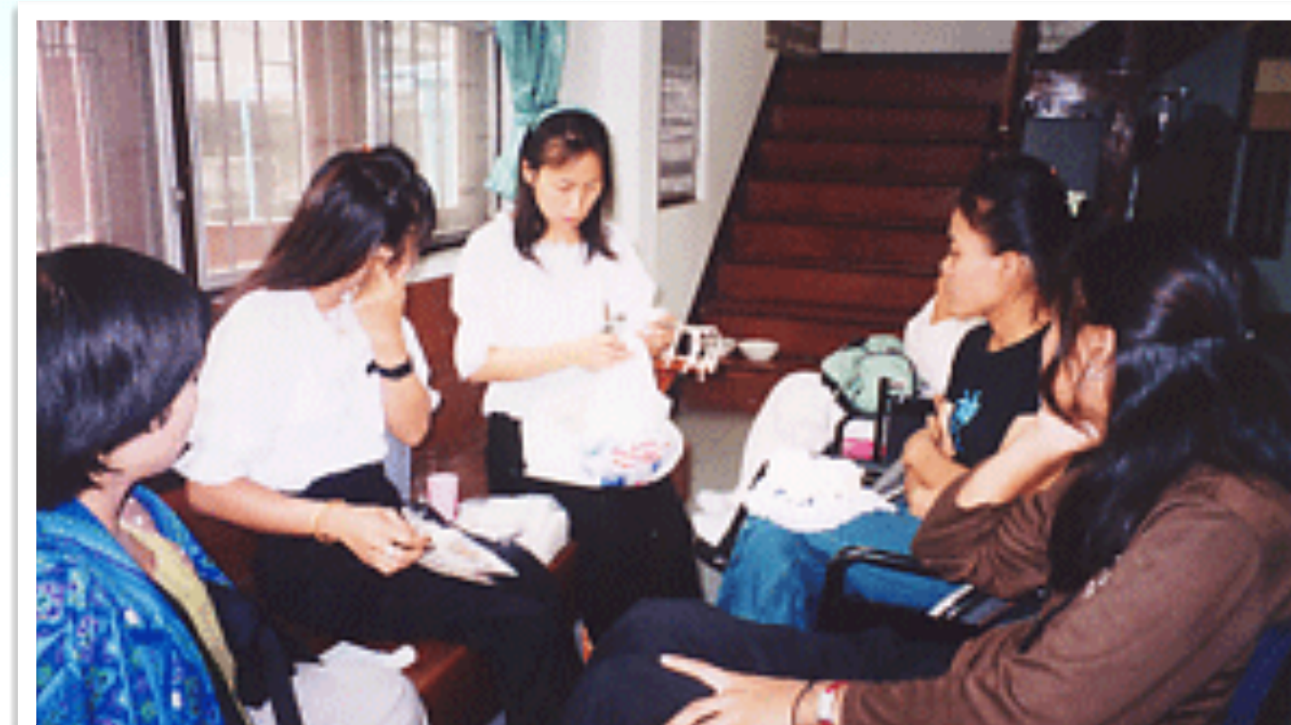
การตลาดสำหรับสินค้าคนพิการ