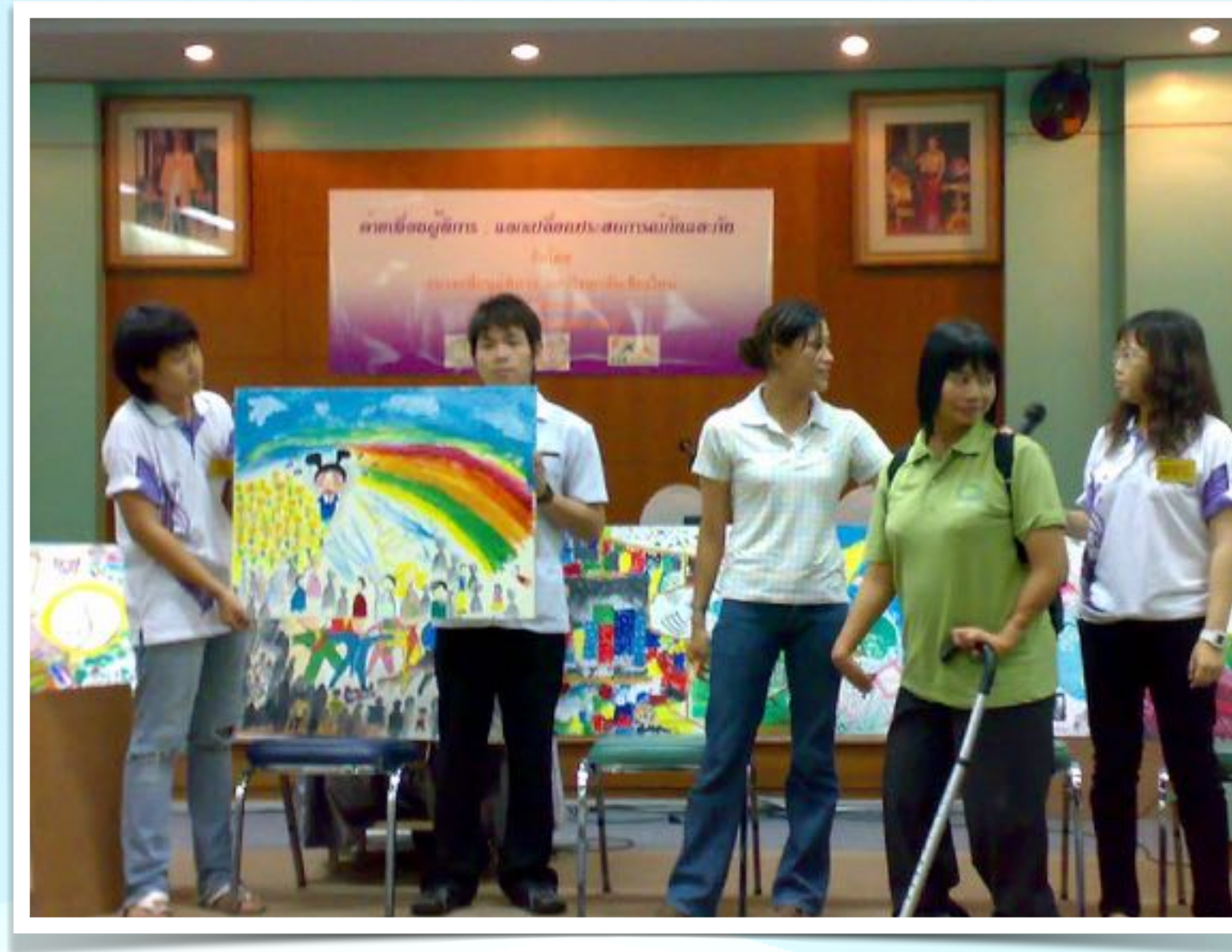
5-8 ต.ค. 2551 ค่ายแลกเปลี่ยนเรียนรู้ ชมรมเพื่อนผู้พิการ มช. ณ สนามกีฬา 700 ปี