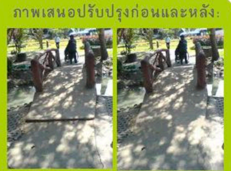
ภาพเสนอปรับปรุงก่อนและหลัง:

1 หมู่ 7 ตำบลบ้านสหกรณ์ กิ่งอำเภอแม่ออน จังหวัดเชียงใหม่ 50130 โทรศัพท์ : 0 5303 7101, 0 5392 9077, 0 5392 9099 แฟกซ์ : 0 5303 7102