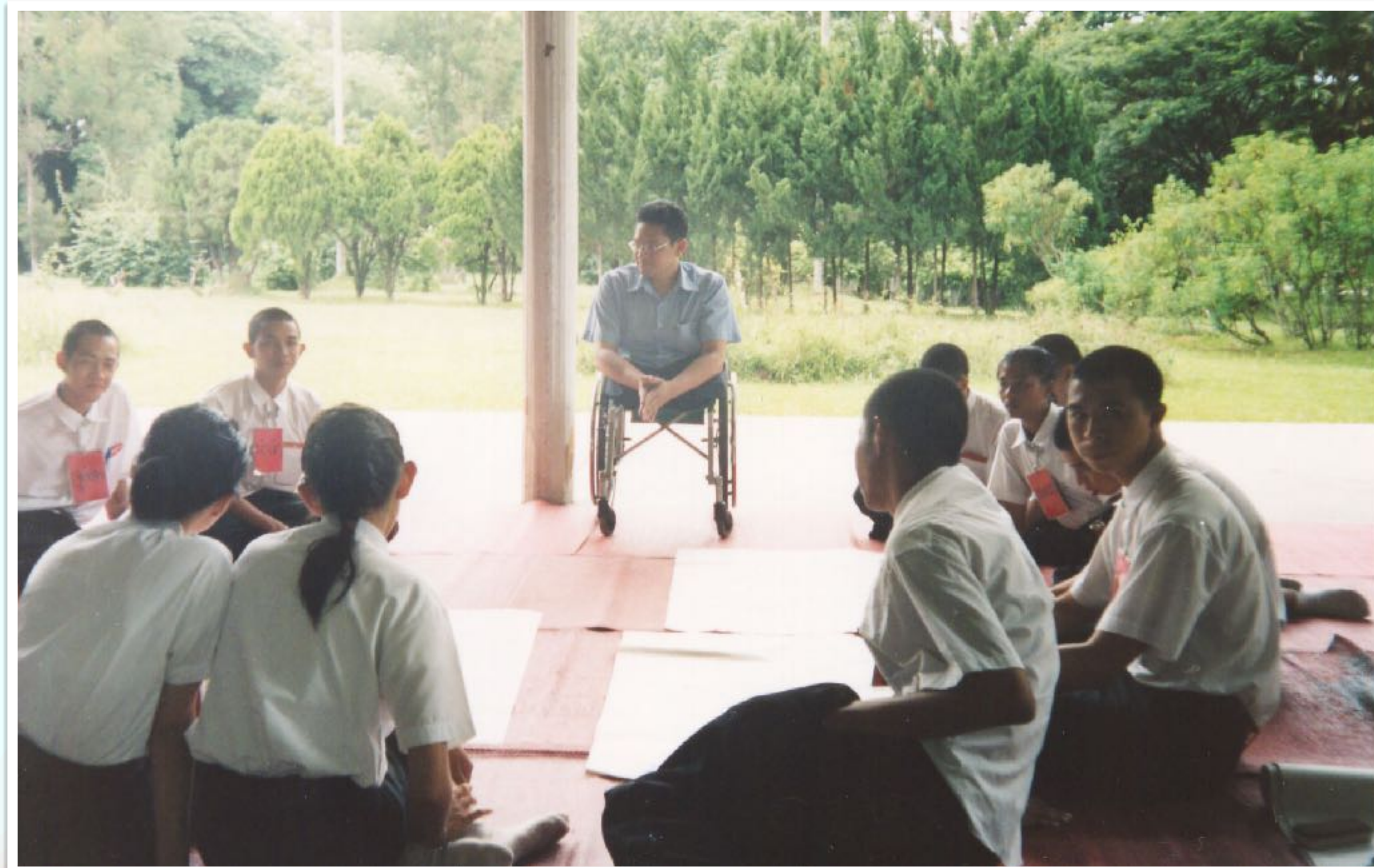
ร่วมสังเกตการณ์จัดอบรมจริยธรรมนักศึกษา มช. ณ ศาลาอ่างแก้ว มช.