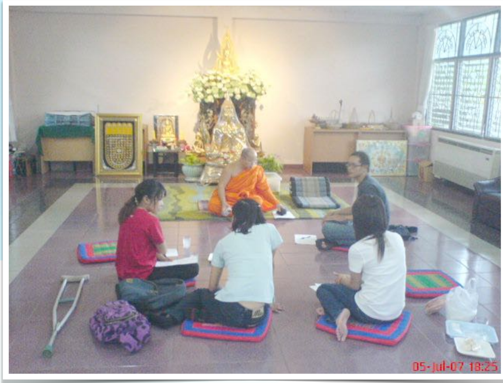
ร่วมเครือข่ายวิทยุชุมชน รายการ ฃญ่าชุมชน โดยศิษย์เก่าคณะกรรมการสื่อสารมวลชน มช.