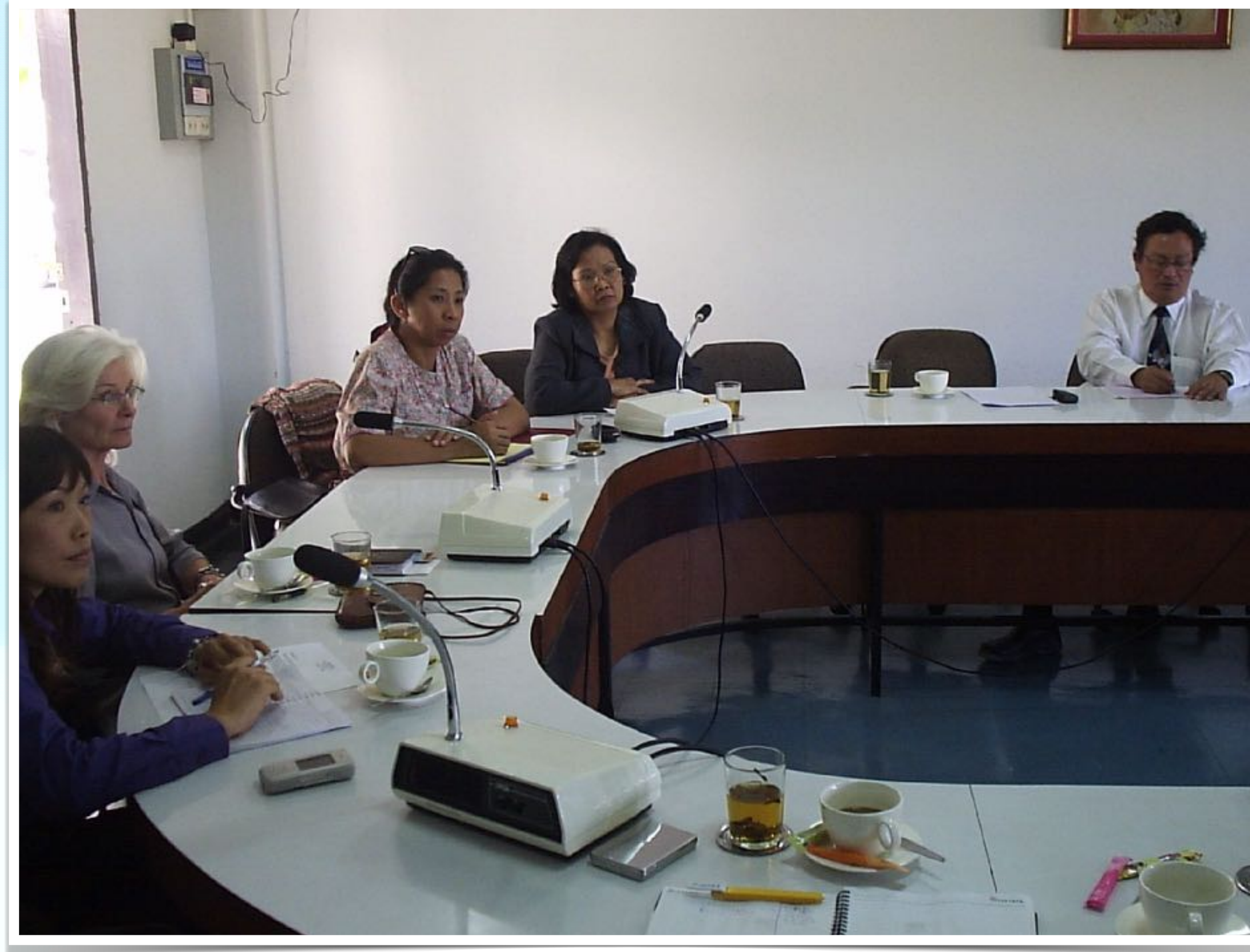
ม.ค. 2549 ประชุมหารือกับคณาจารย์ด้านการศึกษาพิเศษ ณ คณะศึกษาศาสตร์ มช.