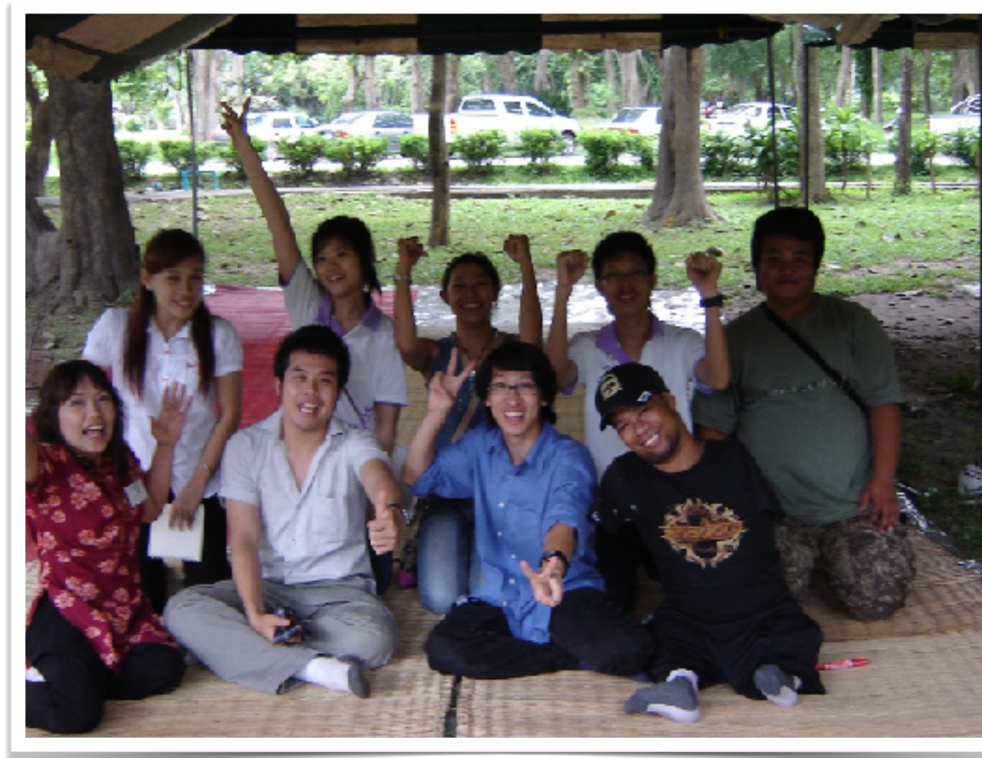
29-31 ส.ค. 2551 วิทยากรอบรมจริยธรรมนักศึกษาปีที่ 1 มช.