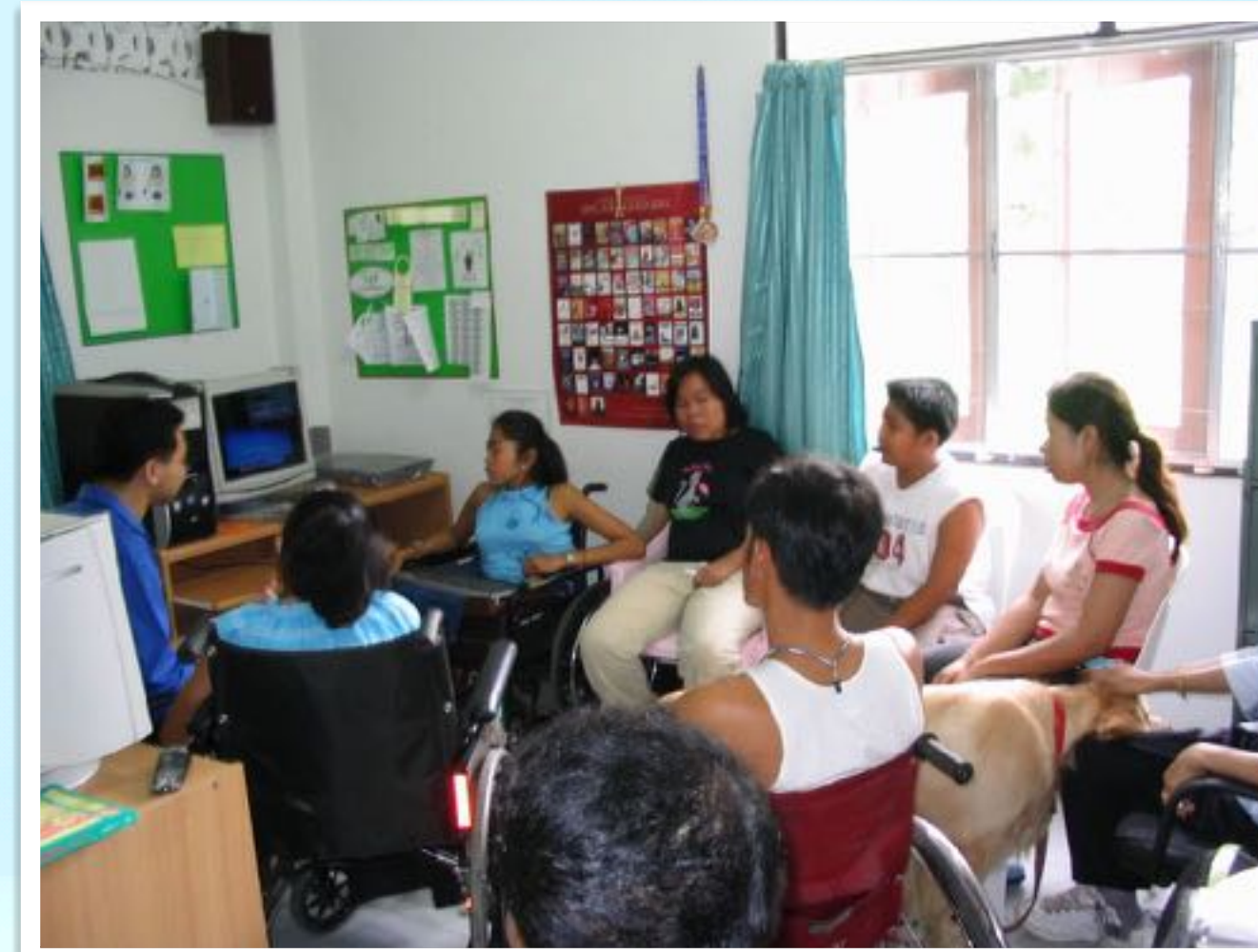
ชั้นเรียนการใช้เสียงและร้องเพลง