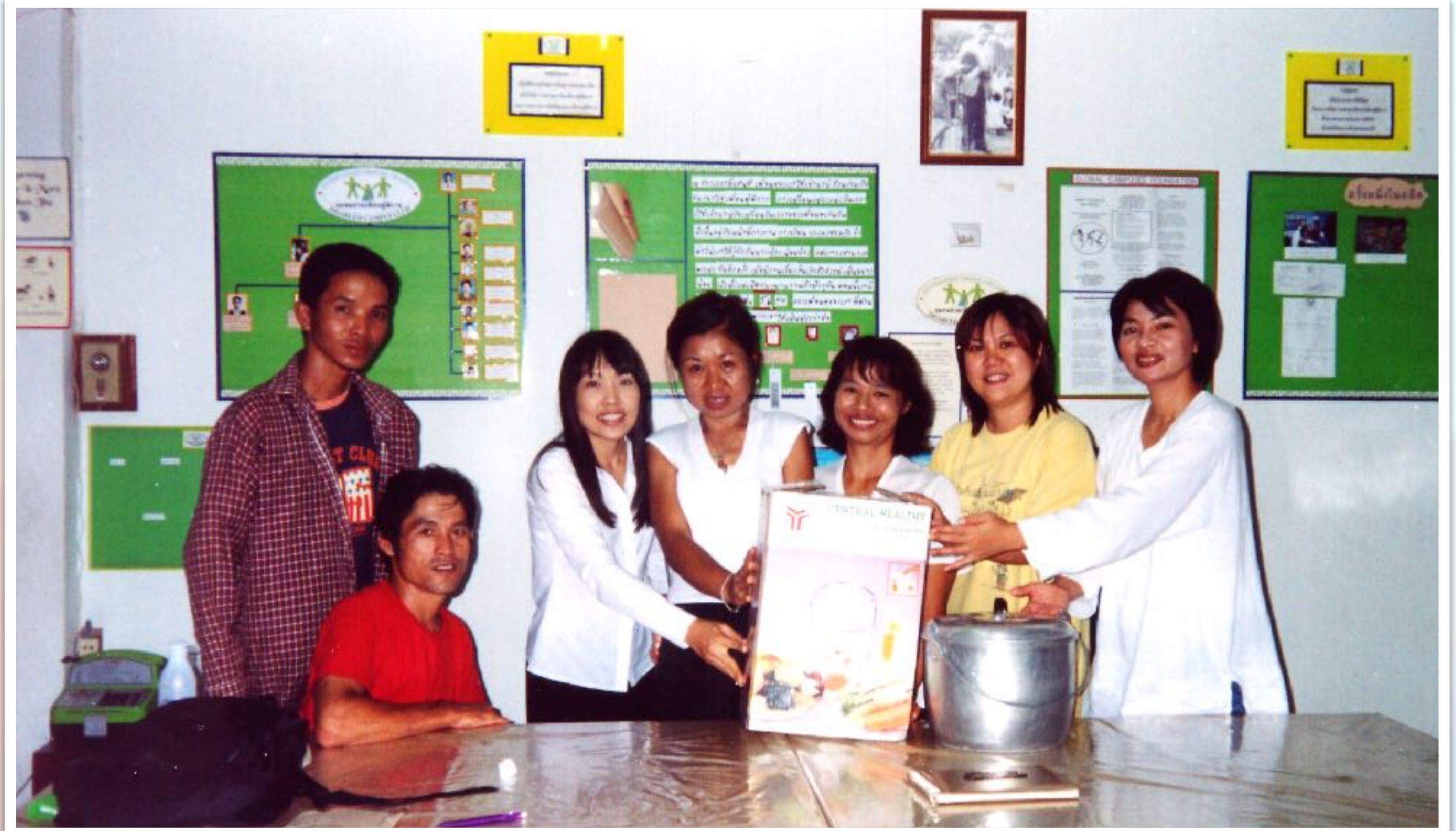
รับมอบเครื่องทำน้ำเต้าหู้จากอาจารย์คณะพยาบาลศาสตร์ มช.