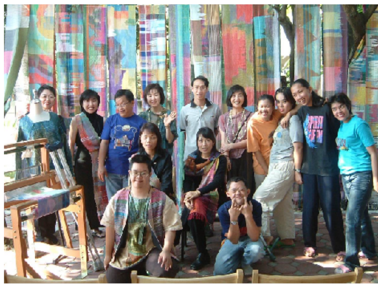
SAORI PROJECT (JICA, Japan)