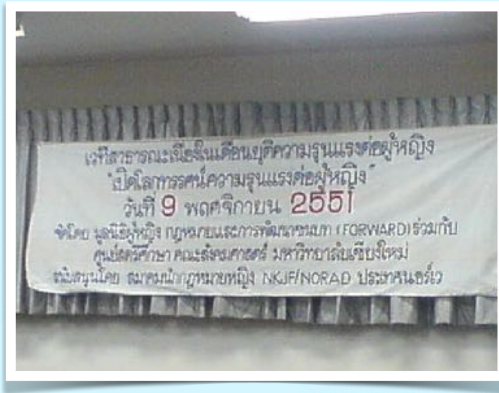
9 พ.ย. 2551 - ร่วมเวทีสาธารณะ ความรุนแรงต่อสตรี ณ ศูนย์สตรีศึกษา มช.