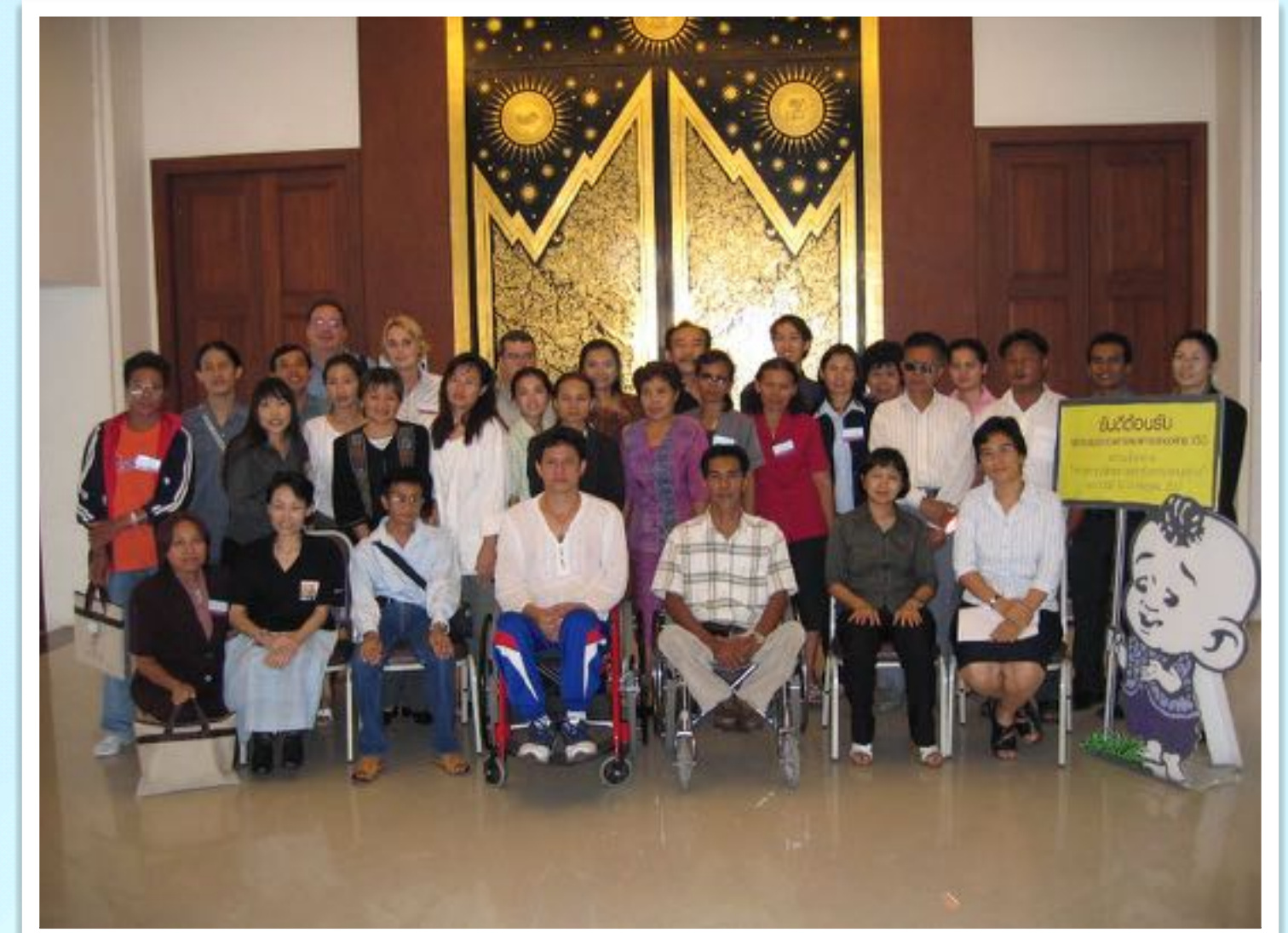
อาสาสมัครอังกฤษประจำประเทศไทย (VSO)