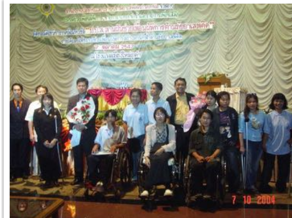
คอนเสิร์ตการกุศล (ปปส.ภาค5)