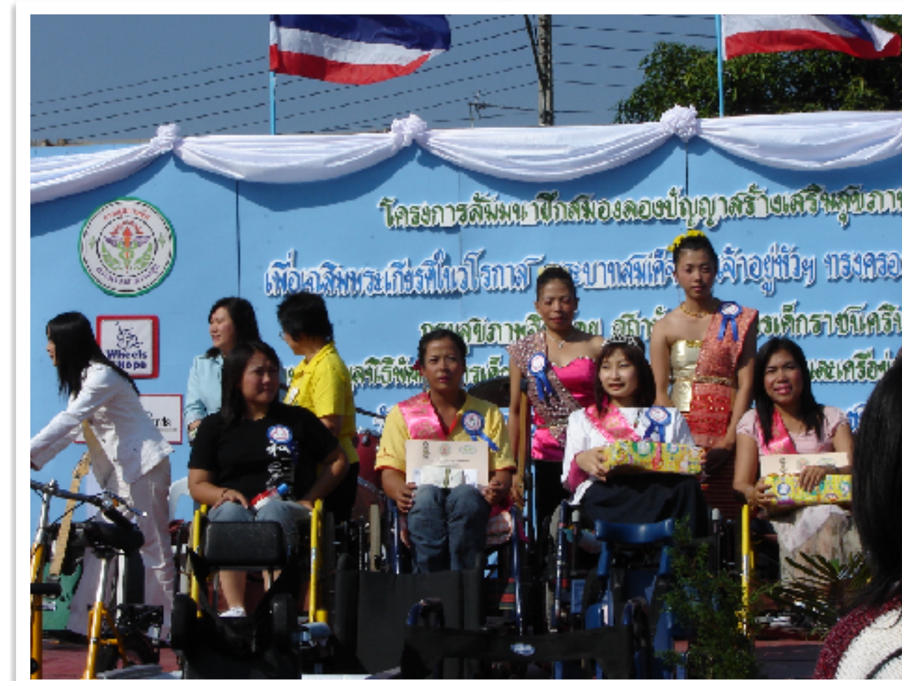
จัดการประกวด Miss Beautiful Mind ในงานสุขภาพจิตผู้พิการ ณ สถาบันพัฒนาเด็กราชนครินทร์