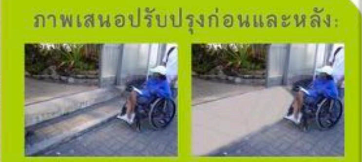
ภาพเสนอปรับปรุงก่อนและหลัง: