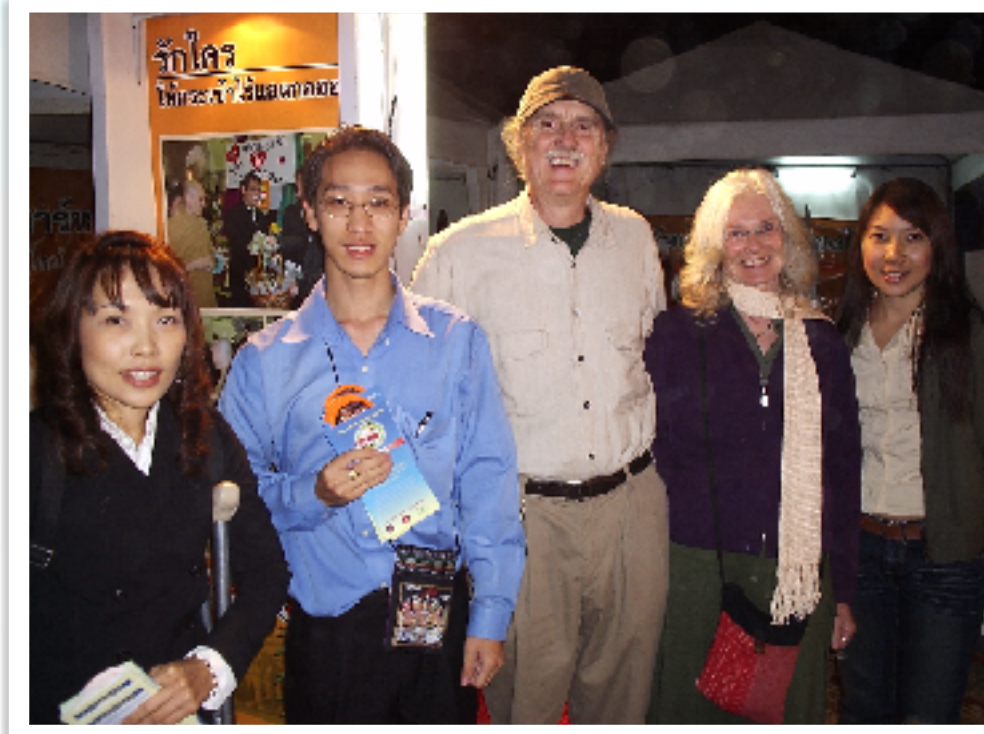
ตั้งสตีก่อนสตาร์ท (สสส.)