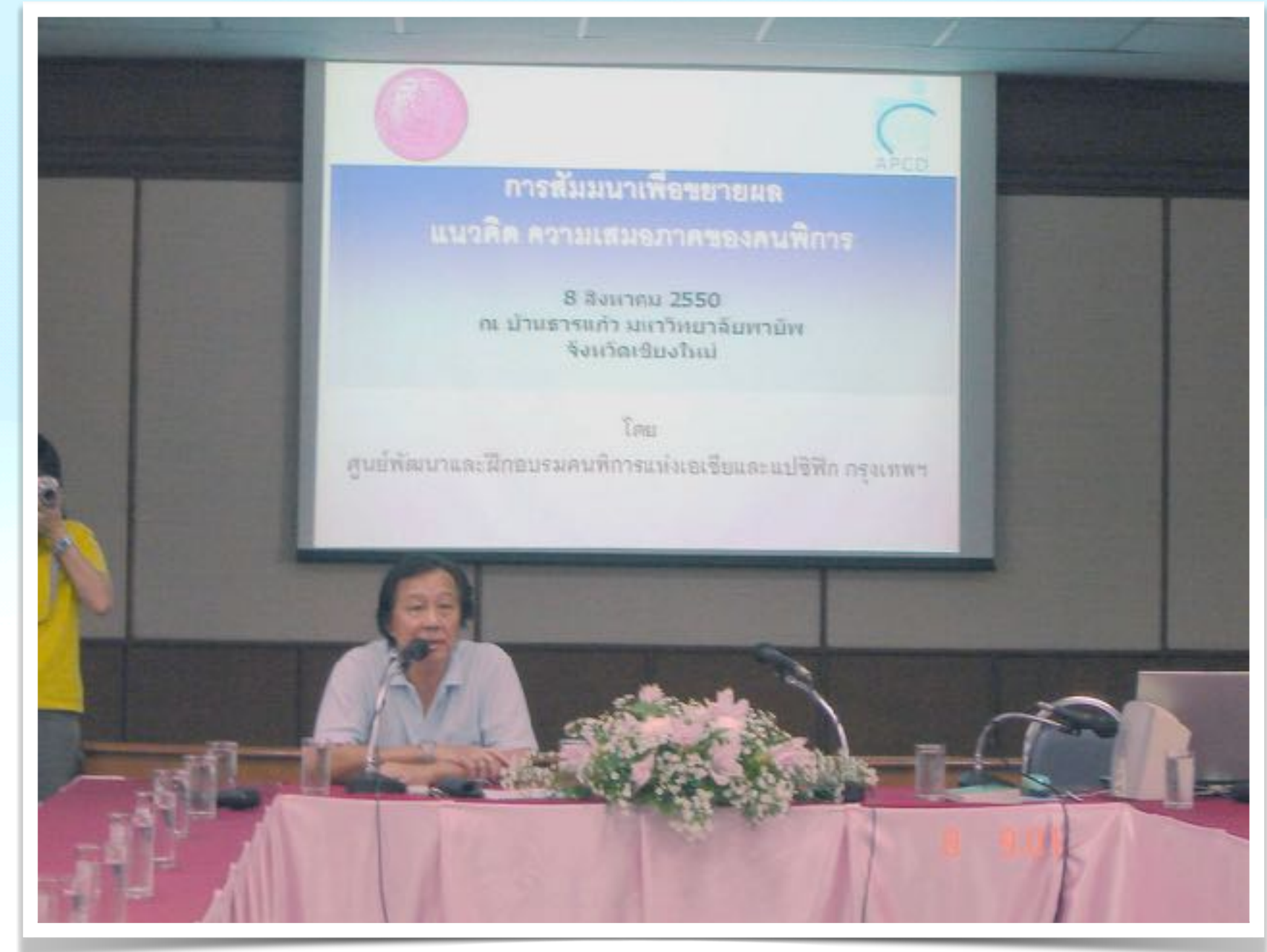
8 ส.ค. 2550 สัมมนาขยายแนวคิดความเสมอภาคคนพิการให้กับบุคลากร มช.