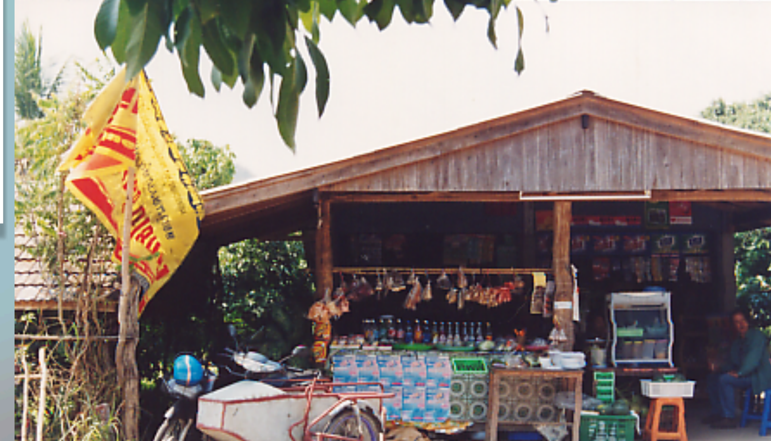
มอบทุนประกอบอาชีพให้กับสตรีพิการ จ.ลำพูน