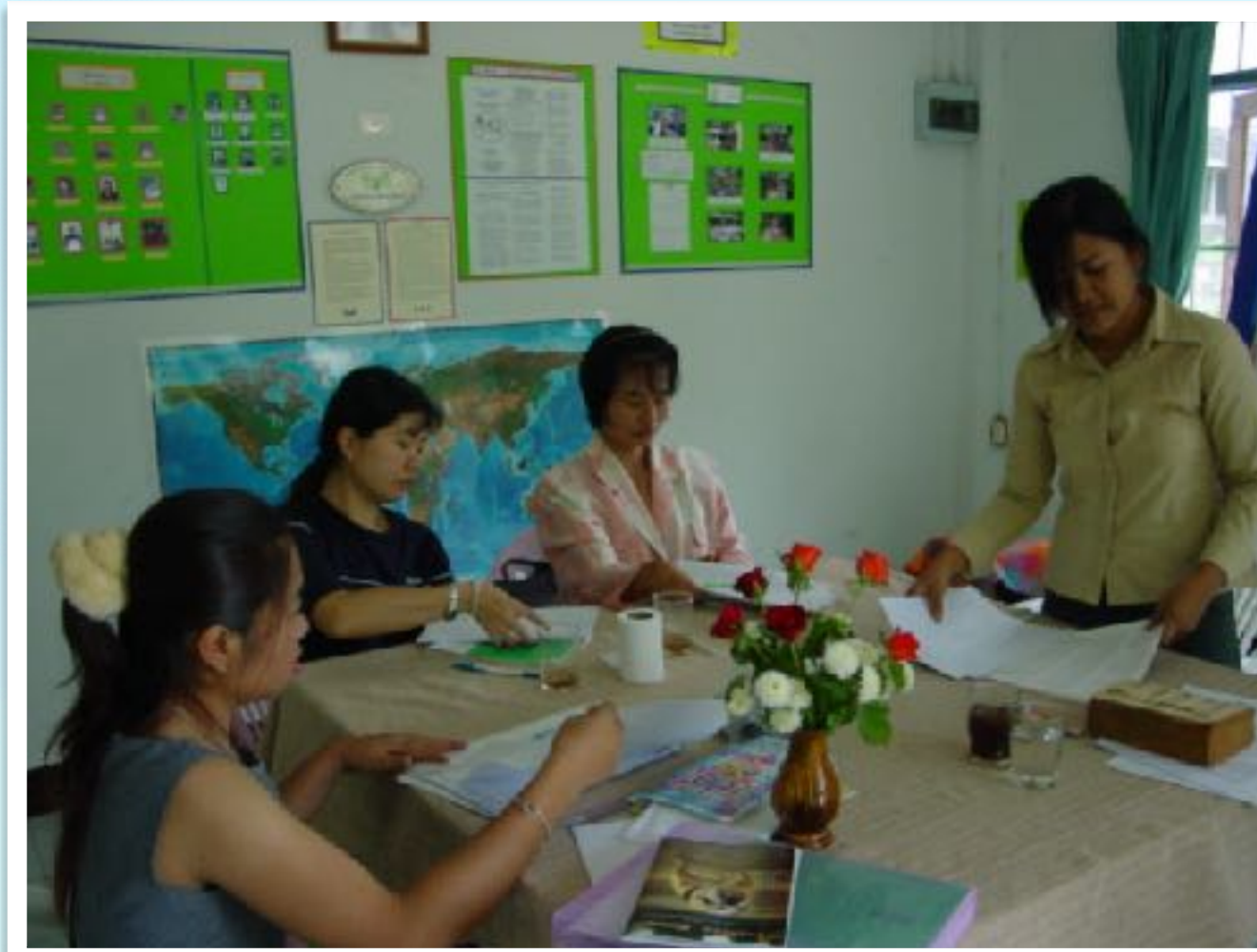
ชั้นเรียนภาษาอังกฤษ