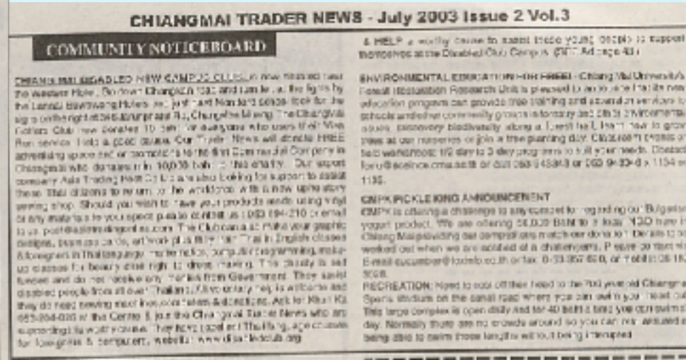
Free Copy “ Chiangmai Trader News”